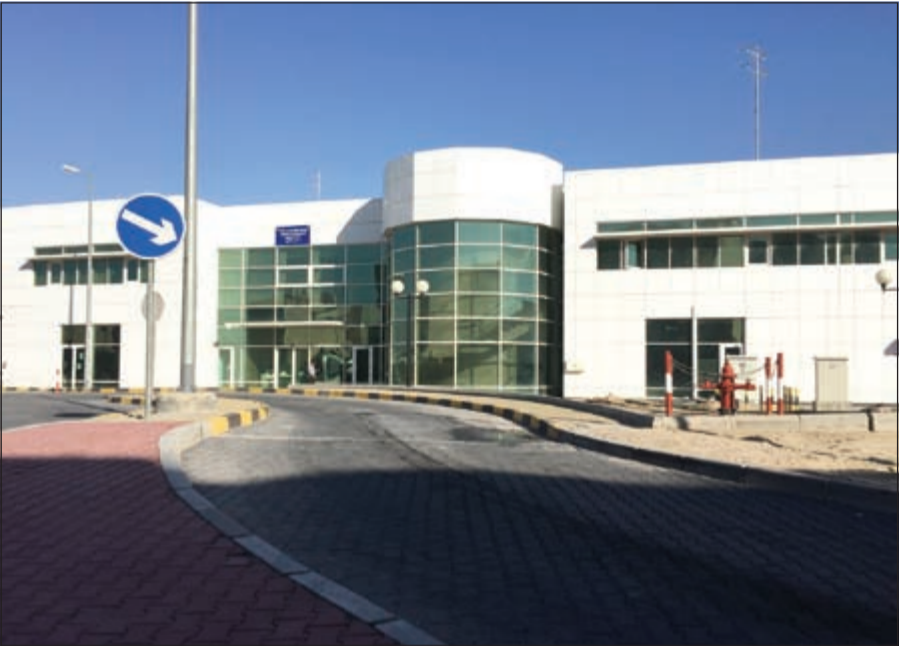
لحد المباني الخدماتية الجديدة