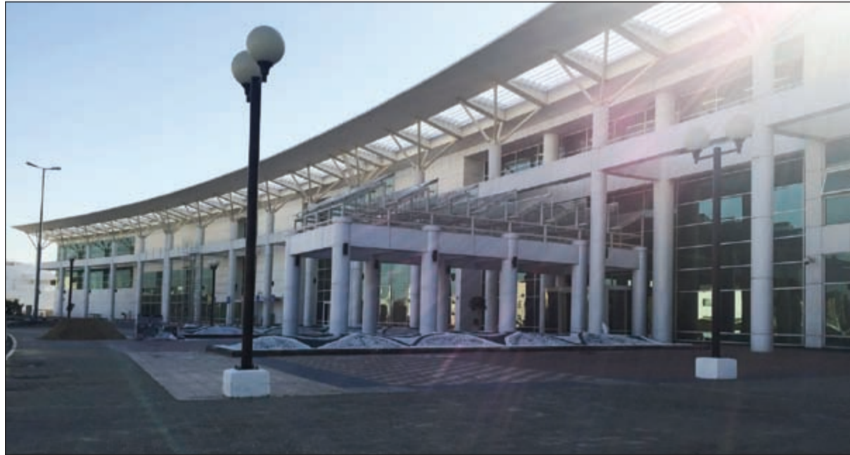
محور الخدمات لم يستغل منذ 4 سنوات

وتجعلها في مرمى نيران العزاب، والخارجين على القانون والعمالة السائبة، معربا عن خشبته من تغير التركيبة الاجتماعية للمنطقة بسبب غياب التواجد الأمني فيها. وأشار إلى أن مداخل ومخارج المنطقة بحاجة إلى أن ينظر لها بعين الاعتبار خصوصا الإشارة المرورية ووضعها الخاطئ في العديد من الحوادث الخطيرة، لافتا إلى ضرورة تحويلها إلى دوار لتلافي الوضع الحالي، وأعرب عن أمله في تحرك سريع من قبل الوزارات المعنية لإنشاء مخفر في المنطقة وتفعيل الجهات الرقابية لمخافة الظواهر الدخيلة وتطبيق القانون بصورة تردع كل من تسول له نفسه مخالفته.