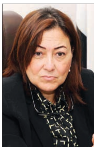
السفيرة هويدا عبدالرحمن

وقالت عبدالرحمن في تصريحات لـ «الأنباء»، إن القنصلية تسلمت خلال العام الأخير فقط أكثر من 55 ألف طلب جواز سفر تم استيفائها بشكل فوري وإرسالها لاستخراج الجوازات، موضحاً أن ذلك يعادل ما يتم استقباله في 5 سنوات كاملة، مؤكدة «تم بالفعل إنجاز أكثر من 50 ألف جواز سفر وتسليمها إلى المواطنين المصريين المقيمين في الكويت وسيتم تسليم البقية خلال الأسابيع المقبلة».