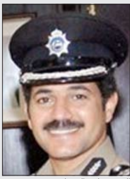
العقيد وليد الشهاب

وقال مصدر اميني ان رجال امن الجهراء وتحديدًا مخفر منطقة النعيم كانوا يصدون نقل 9 أشخاص من الجنسية الأفريقية والإسيوية الى إدارة الإبعاد وأثناء خروجهم من المخفر هرب الوافدون باتجاهات مختلفة فتمت مطاردتهم من قبل رجال الأمن الذين استنطاقوا بعد فترة ليست