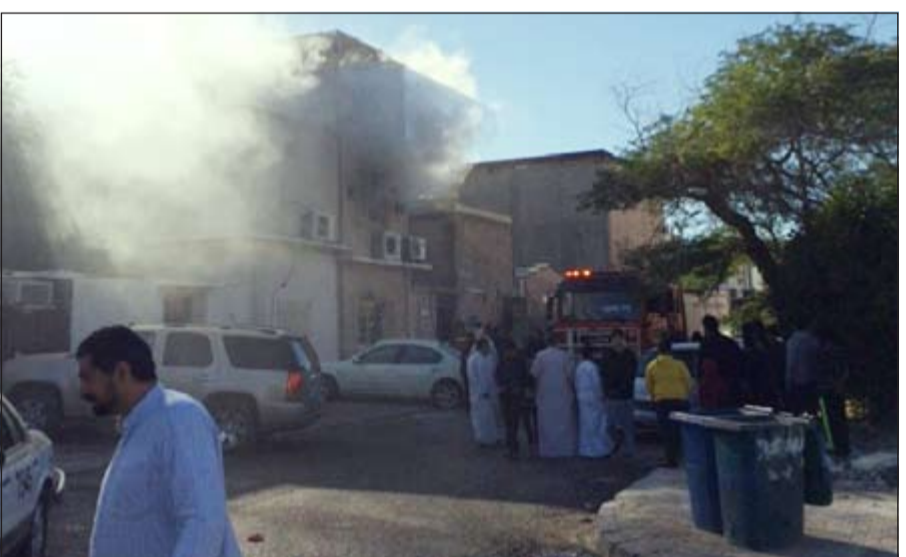
الحريق الذي ابتلع غرفة الواحة