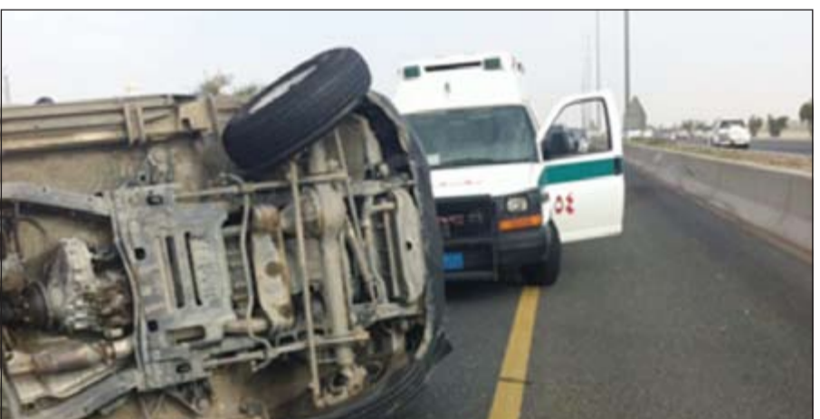
حادث انقلاب طريق الدائري السادس

من جانب آخر، قسام رجال أمن الجهراء بتوقيف الطريق بعد انقلاب مركبة يابانية تسببت في إصابة قائدها قرب صناعة الجهراء، وتم إدخال الشهاب الى مستشفى الفروانية والجهراء ووصفت حالتها بالمستقرة.