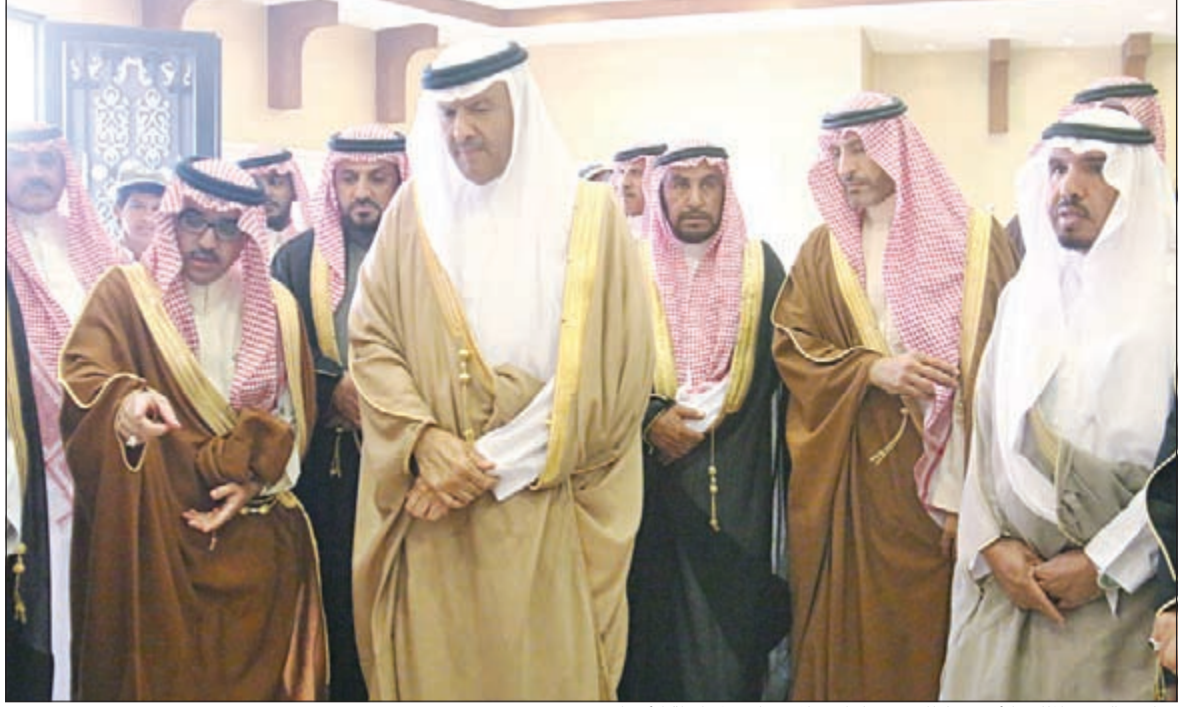
صاحب السمو الملكي الأمير سلطان بن سلمان خلال زيارته لمحافظة الأسياح

عن اعتماد ثلاث مبادرات لمحافظة الأسياح وهي إعادة وترميم بعض الآثار التي يعود تاريخها لأكثر من 150 عاما والتي قاومت حصارا امتد لأكثر من 6 أشهر بسبب تأييدها للدولة السعودية ومناصرة الدعوة الإصلاحية وترميم البرق التراثية وترميم المساجد التاريخية بالمحافظة. وفي نهاية الزيارة اطلع سموه بعد ذلك على منتزه سمو الأمير فيصل بن بندر وسد مارذ بالأسياح الغني بأمطار الخير والبركة التي تتم المملكة هذه الأيام.