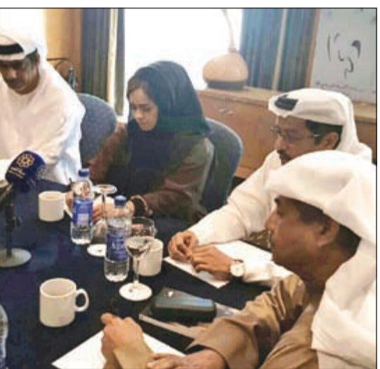
الوفد الاماراتي في مؤتمرهم الصحافي

نا أهمية وقديماً اهميته تعادل اهمية «الخبز» في حياتنا اليومية وهي عبارة عن وجبة ثقافية وذات اهمية كبيرة وحاليا نجد مسالة قلة الدعم وعدم وجود اماكن للمسرح ومقرات وأشيد بدور الصحافة الكويتية وكذلك الاعلام على اهتمامهم بالمسرح وهذا الامر يحسب للكويت بدون اي مجاملة اقولها. وعن ظروف الرقابة والحرية التي تعطى للفنان قال: لا نحس باي اشكالية في مسالة الرقابة