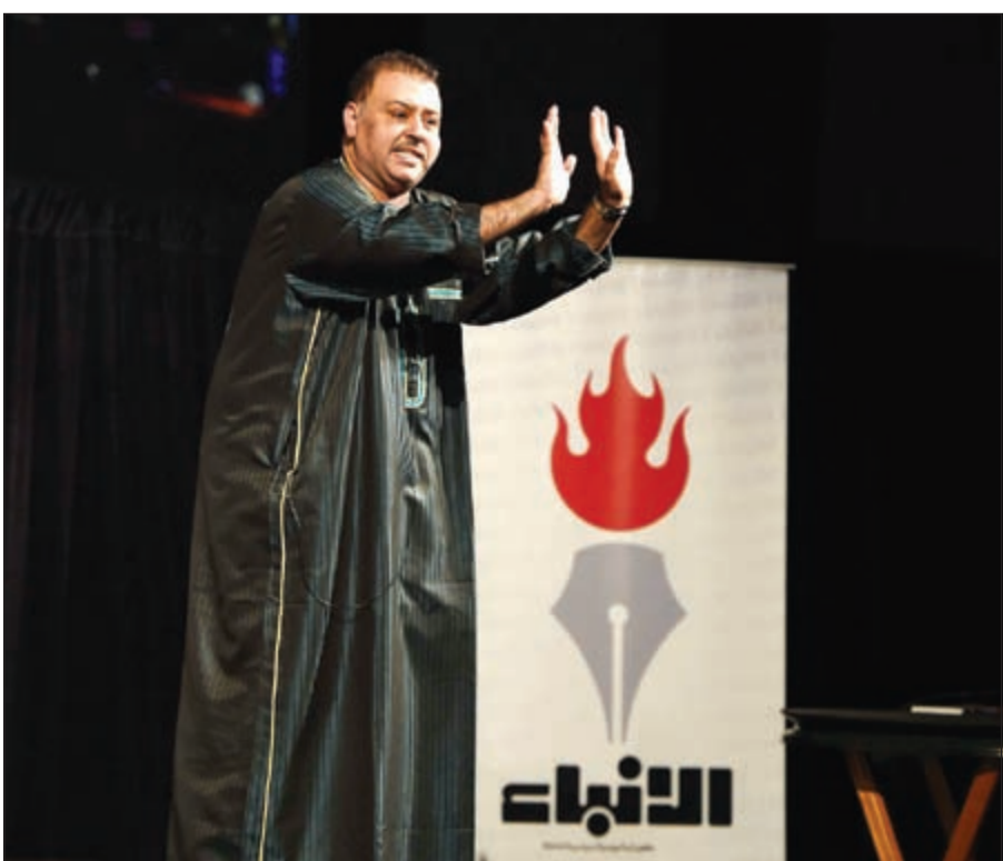
النجم حسن البلام في أحد مشاهد مسرحية «مر يا حلو»

قال نائب مدير إدارة شؤون الموظفين في الهيئة العامة للاستثمار عادل الوسمي إن الهيئة تُعتبر من المؤسسات الرائدة في تدريب وتأهيل الشباب الكويتي حديث التخرج، مضيفاً أن الغرض الرئيسي للهيئة هو الاستثمار للأجيال القادمة بعد أن أخذت على عاتقها تدريب الشباب الكويتي. وأضاف الوسمي: ففي الوقت الحالي تم تخريج الدفعة الـ 32 وكل سنة تأخذ دفعتين تدريبيتين وبذلك نحن نتحدث عن 11 سنة خبرة في مجال تطوير وتدريب الشباب الكويتي.