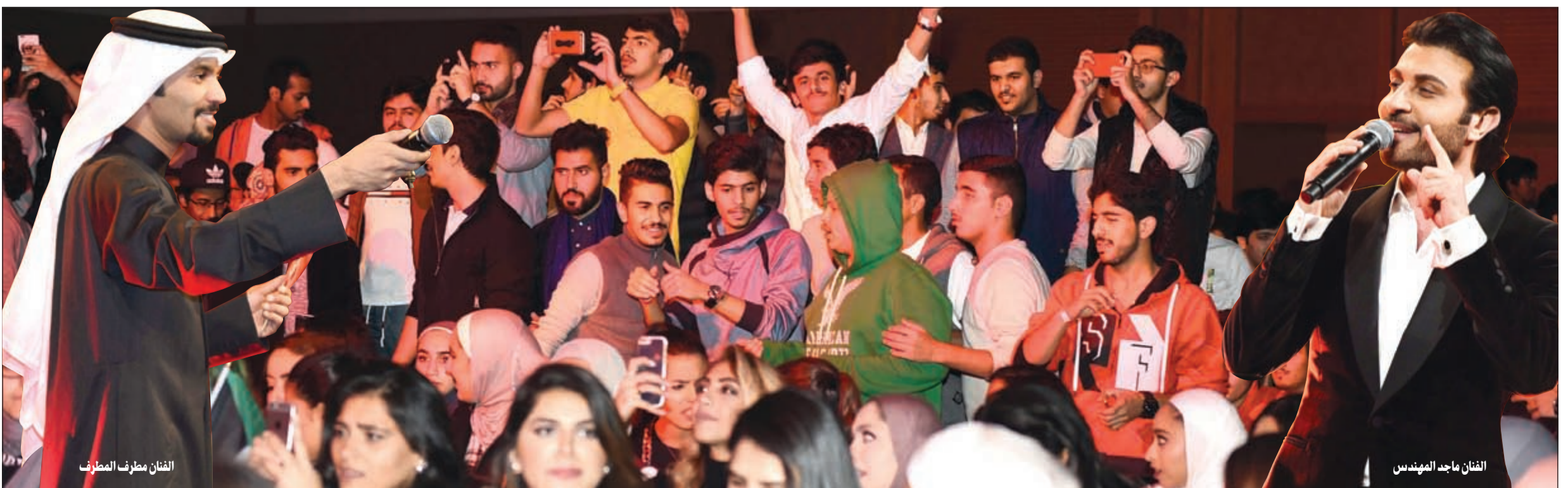
الفنان مطرف المطرف