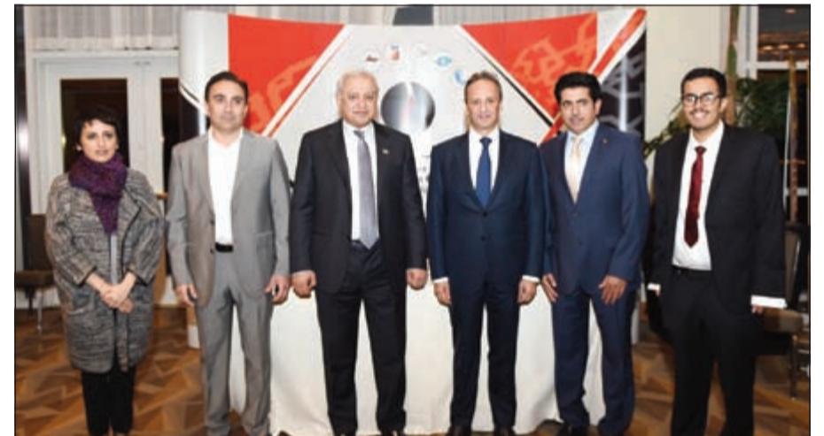
.. وفي جناح مؤسسة البترول