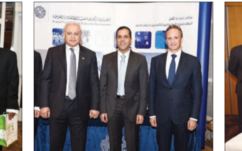
جناح الصندوق الكويتي للتنمية