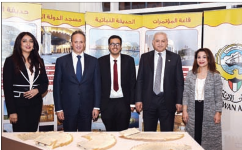
الوزير العيسى والسفير الشيخ سالم عبدالله في جناح الديوان الأميري