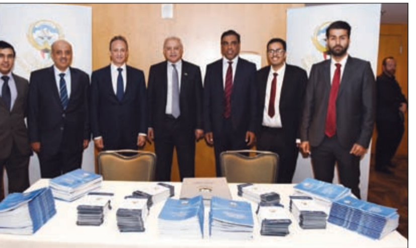
الوزير د. بدر العيسى والسفير الشيخ سالم عبدالله في جناح الهيئة العامة لمكافحة الفساد