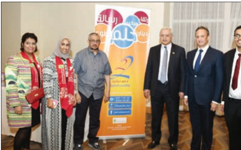
راعي المؤتمر والسفير الشيخ سالم عبدالله ومحمد الزايد في جناح «ادف بنديارين واكسب الدارين» لحد مشاريع الهيئة الخيرية الإسلامية العالمية

في أكبر تجمع كويتي خارج البلاد، التقى الآلاف من طلبة الكويت الدارسين في أميركا بمدينة سان دييغو الأسبوع الماضي، حيث انتخبوا الهيئة الإدارية الجديدة لاتحادهم، وشاركوا في مناسبة مميزة بكل معنى الكلمة بعناوينها الثقافية والسياسية والرياضية والفنية التي جانب أبعادها الوطنية. وعلى مدى ثلاثة أيام متواصلة بليلاتها، بدأ فندق «هيلتون بايفرونت» كخليقة نحل لا تهدأ بدءا من حفل الافتتاح الذي رعاه وحضره وزير التربية ووزير التعليم العالي د. بدر العيسى وسفيرنا في واشنطن الشيخ سالم عبدالله وصولا الى حفل الختام الذي انضم اليه سفير الولايات المتحدة في الكويت دوغلاس سيليمان. حظيت المناسبة برعاية