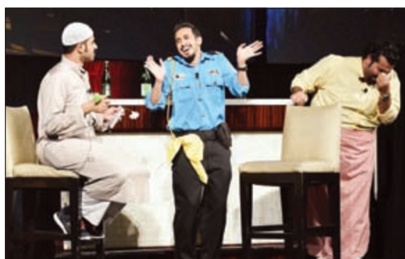
النجوم فهد البناي ومحمد الرمضان وعبدالعزيز النصار