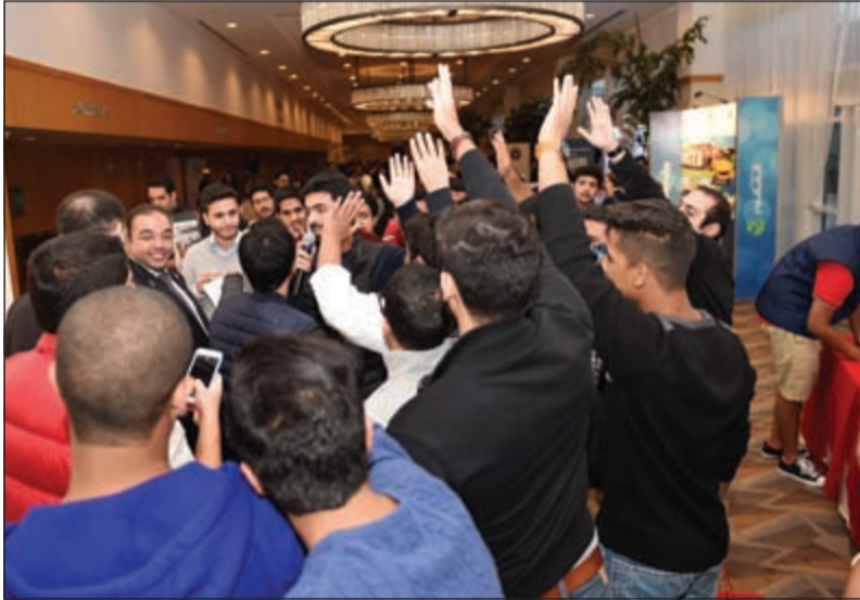
حشد من الطلاب خلال تواجدهم أمام جناح «الانباء» في المؤتمر