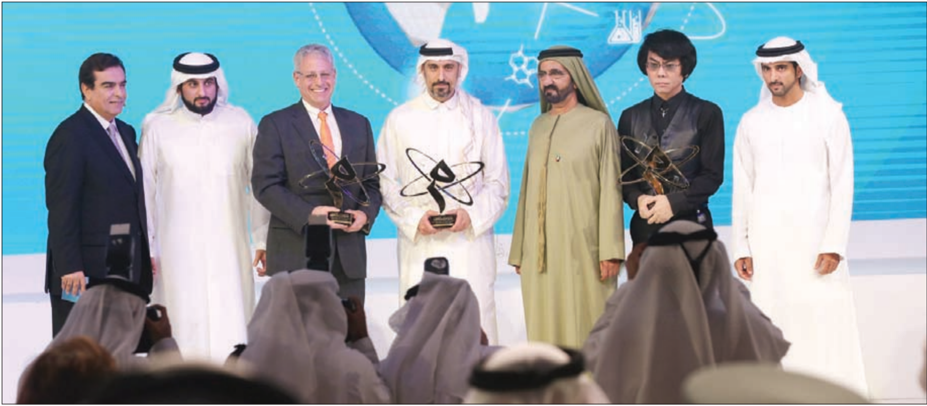
سمو الشيخ محمد بن راشد مع الفائزين بجائزة المعرفة

واستعرض الشقيري مؤشر التعليم قائلا إنه في عام 1960 كانت نسبة اللامية هي 18% في الدول العربية أما في عام 2015 فوصلت النسبة إلى 82% قائلا إنه بالرغم من أنه إنجاز حسب للدول العربية إلا أنه غير كاف وعلى الحكومات العمل للوصول بنسبة اللامية إلى 100%، مشيراً في الوقت نفسه إلى التطور الخاص في دول الخليج، حيث تخطت نسبة اللامية بها 95% كذلك الأمر في الأردن ولبنان أما في دول مثل تونس ومصر فمازالت هناك نسبة من الأمية وناتى الصومال كأكثر دولة بها نسبة أمية حيث بلغت الأمية فيها 38%.