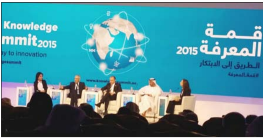
المحدثون في الجلسة الافتتاحية

والارتقاء بالمجتمع. وقال بان كي مون: «صاحب السمو الشيخ محمد بن راشد أظهر قيادة مثالية وريادية وغير مسبوقه مكنت من تحقيق التقدم وإحداث القفزات النوعية في الكثير من المجالات». وأضاف بان كي مون: