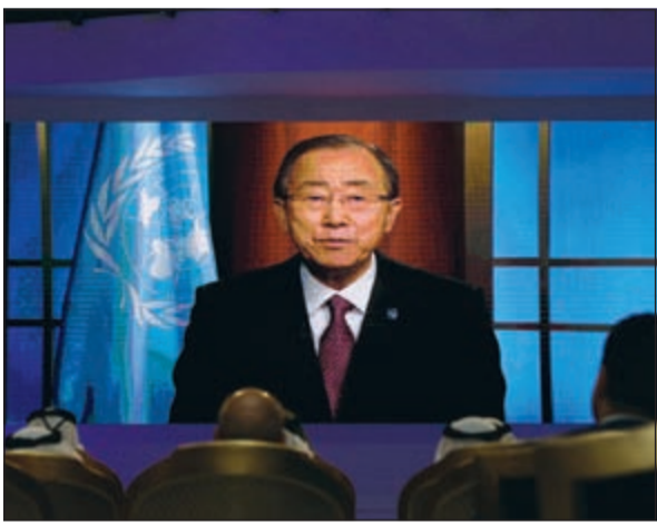
لقطة من الكلمة المتلفزة للأمين العام للأمم المتحدة