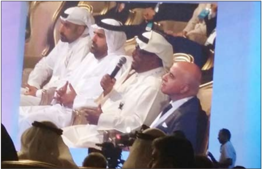
رئيس شرطة دبي الفريق ضاحي خلفان خلال مباحثته

التي حضرها كل من ولي عهد دبي الشيخ حمدان بن محمد بن راشد، ورئيس مؤسسة محمد بن راشد آل مكتوم الشيخ أحمد بن محمد بن راشد، وعدد من الوزراء والمسؤولين بالدولة بالإضافة إلى حضور عربي وعالمي كبير، الذي العضو المنتدب بمؤسسة محمد بن راشد آل مكتوم جمال بن حويرب كلمة هنا فيها بداية رئيس دولة الإمارات صاحب السمو الشيخ خليفة بن زايد وصاحب السمو الشيخ محمد بن راشد بالعيد الوطني للإمارات، كما استذكر تضحيات الشهداء