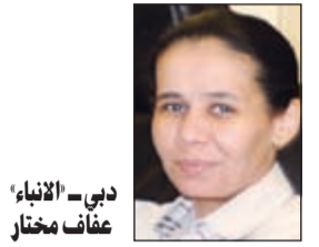
د. دها - الأناب عفاف مختار

أشاد نائب رئيس دولة الإمارات العربية المتحدة، رئيس مجلس الوزراء حاكم دبي سمو الشيخ محمد بن راشد بالطاقت العلمية والتقنية التي تختزلها عقول الشباب العربي، مؤكداً أن الإمارات ستظل الحاضنة لهذه الطاقات وتدعمها وتشجعها من أجل إسعاد المواطن العربي أينما كان.