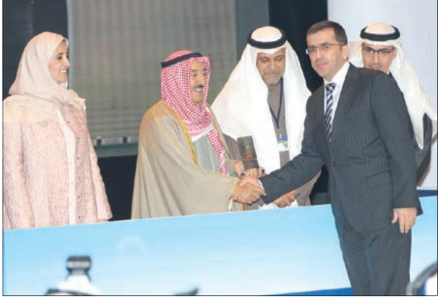
صاحب السمو الأمير الشيخ صباح الأحمد مكرماً أحد الفائزين