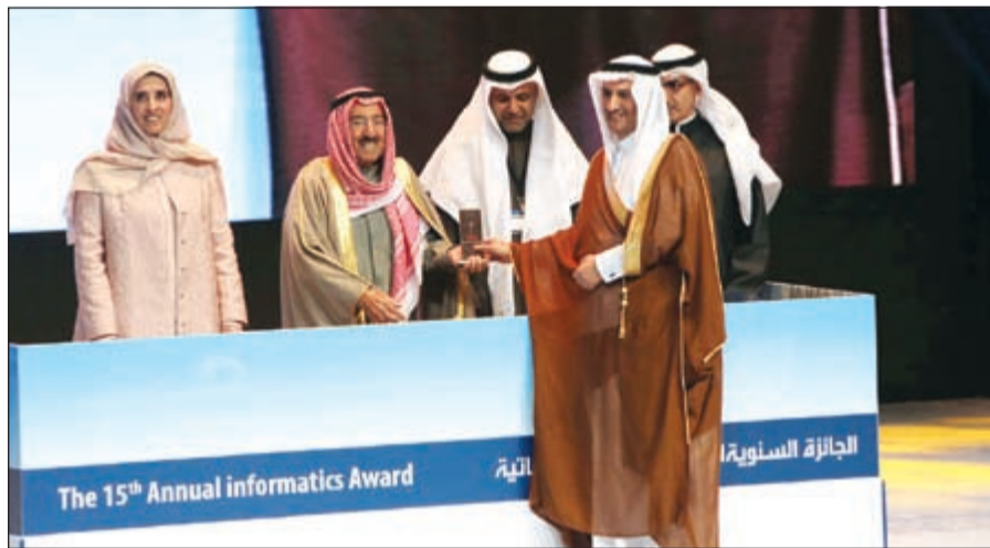
صاحب السمو الأمير الشيخ صباح الأحمد مكرماً أحد الفائزين

وأضافت الشخة عابدة: إن شمائل العطاء بإكرام وخصال التعاون باحترام عناوين بارزة احتذى بها متطوعو الجائزة، كما ارتاد هذا الطريق أعضاء مجلس التحكيم العربي فاستحق هؤلاء وهؤلاء الشكر والثناء. أما ضيوفنا الفائزون