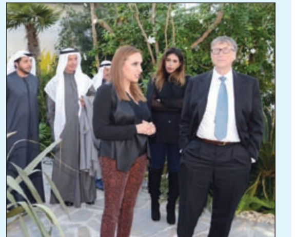
وليام هنري غيتس خلال زيارة حديقة الزهور بقصر بيان وبيدو د. يوسف الإبراهيم وعدد من مرافقيه

قام وليام هنري غيتس الثالث الرئيس المشارك لمؤسسة بيل ومليندا غيتس الخيرية بزيارة الحديقة النباتية «بوتانيكال جاردن» بقصر بيان، ورافقه خلال الزيارة رئيس بعثة الشرف المرافقة المستشار بالديوان الأميري د. يوسف الإبراهيم.