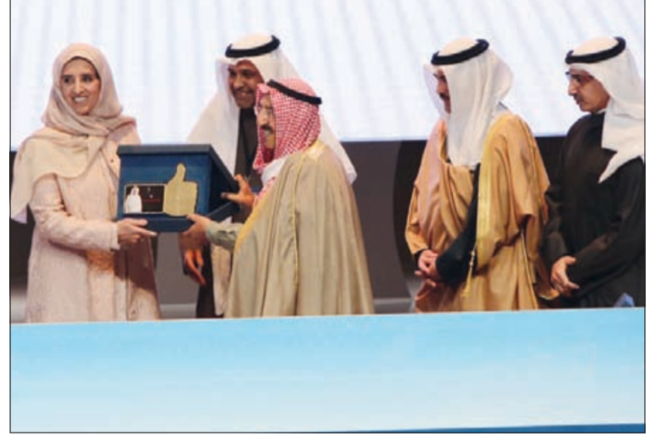
الشيخة عابدة سالم العلي تقدم درعاً تكريمياً لصاحب السمو الأمير الشيخ صباح الأحمد

استخداماً لوسائل التواصل الاجتماعي، ضمن مشروعها مؤشر المعلوماتية الذي تم إطلاقه العام الماضي لقياس مستوى المواقع الإلكترونية والتطبيقات الذكية.