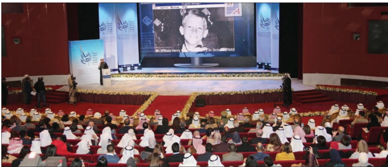
جمع غفير من المدعوين يتابعون فقرات الحفل