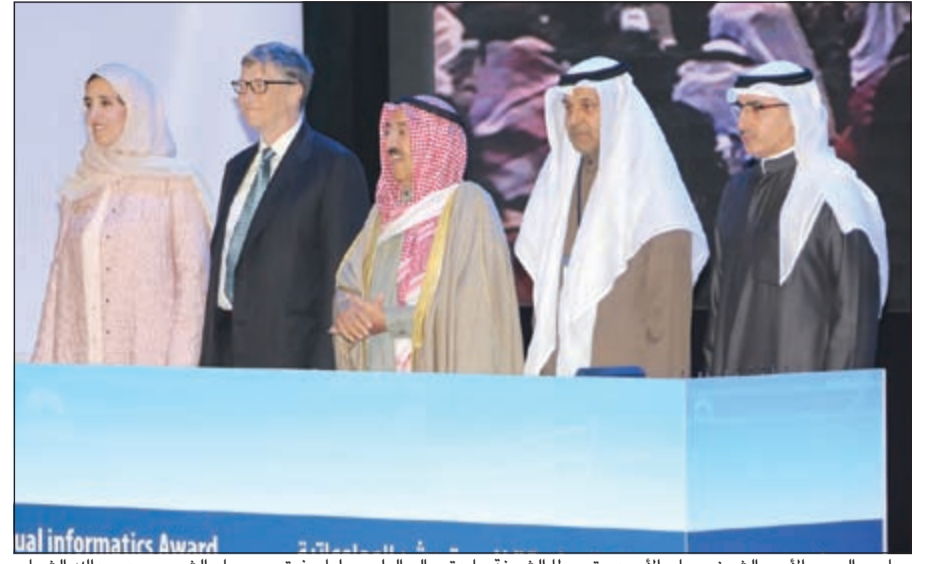
صاحب السمو الأمير الشيخ صباح الأحمد متوسلاً الفائزين بجائزة سمو الشيخ سالم العلي وليام غيتس ويسام الشمري وديعبدالله الشهاب

احتفت أمس بإتمامها العام الخامس عشر من مسيرتها على مسرح قصر بيان