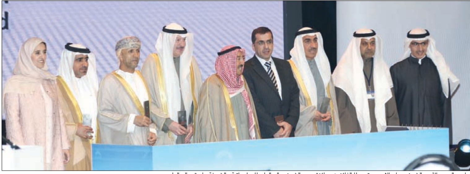
صاحب السمو الأمير الشيخ صباح الأحمد متوسلاً الفائزين بجائزة سمو الشيخ سالم العلي للمعلوماتية والشيخة عابدة سالم العلي