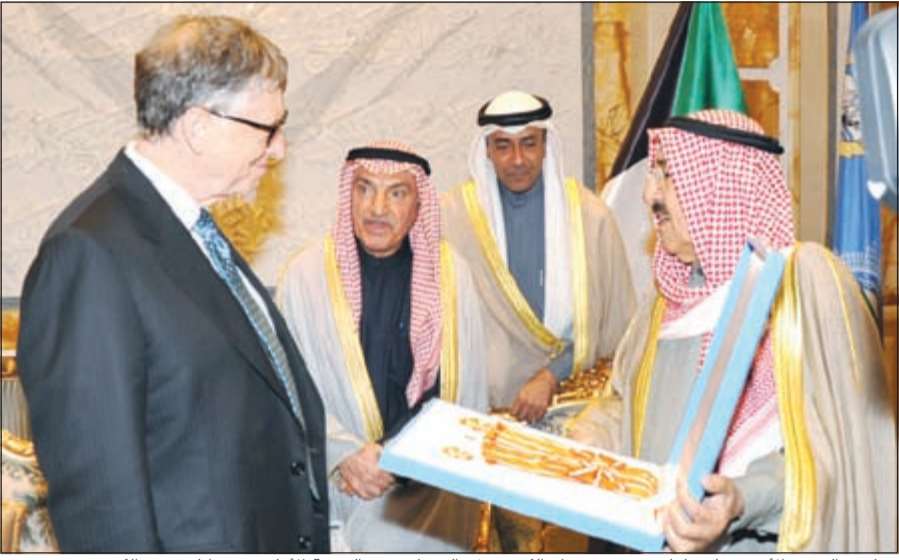
صاحب السمو الأمير يقبل وليام غيتس «وسام الكويت ذو الوشاح» من الدرجة الأولى تقديراً لجهوده الكبيرة