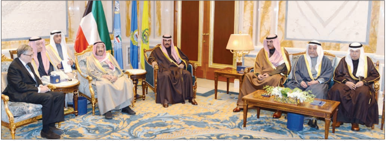
صاحب السمو الأمير الشيخ صباح الأحمد خلال استقباله بيل غيتس بحضور سمو ولي العهد الشيخ نواف الأحمد والشيخ صباح خالد والشيخ علي الجراح والسفير أحمد فهد الفهد والمستشار محمد أبو الحسن