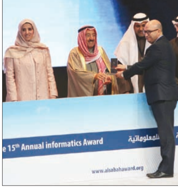
صاحب السمو الأمير يكرم أحد الفائزين