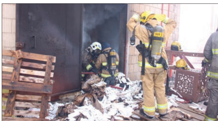
رجال الإطفاء يقومون بالتعامل مع الحريق

محمد الجلاهمة - محمد الدشيش سيطرت 7 فرق إطفاء على حريق هائل اندلع في سرداب يستخدم كمخزن للمواد الغذائية بمنطقة الشويخ الصناعية صباح أمس، وكان حريق قد اندلع في مخزن تبلغ مساحته من 2500م 2 ، وتلقت غرفة عمليات الإدارة العامة للإطفاء بلاغا عن الحادث صباح أمس، فتم توجيه فرق الإطفاء من مراكز الشويخ الصناعية والشهداء والمدينة والفروانية والسامية الجنوبي وصبحان والعمليات والإسناد للتعامل معه، وشرع رجال الإطفاء في مكافحة الحريق الذي نشب في سرداب يتكون من مستودعين الأول محتوياته مواد غذائية وهو الذي اندلعت به النيران، اما المستودع الثاني فهو عبارة عن منجرة تحتوي على قطع من الأثاث طوقتها فرق الإطفاء حتى لا تصل إليها الستة الاهد، واستطاع رجال الإطفاء اخماد النيران دون وقوع أي إصابات بشرية واقتصرت الخسائر فقط