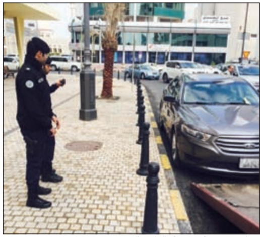
حملات مرورية موسعة بالعاصمة