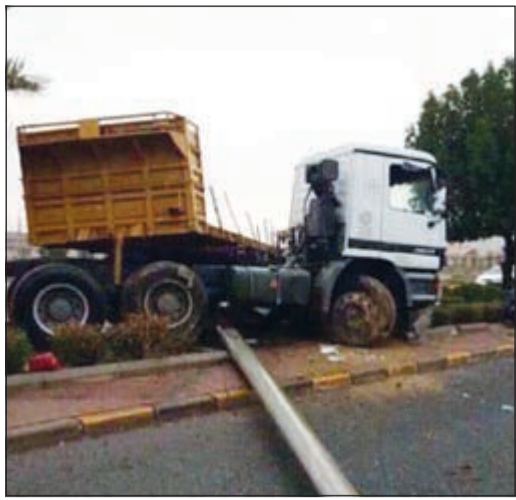
عمود إنارة سقط اثر حادث الشاحنة