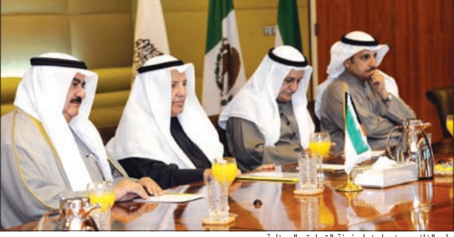
علي الغانم وبعض أعضاء غرفة التجارة والصناعة

استقبل رئيس غرفة تجارة وصناعة الكويت، علي الغانم رئيس حكومة المقاطعة الفيدرالية وعمدة مكسيكو سيتي د. ميغال أنخال ماتساريا ورافقه عدد من كبار المسؤولين، وتطرق الغانم إلى تعزيز العلاقات الثنائية وسبل تنمية وجه التعاون بين البلدين الصديقين، مؤكداً على أهمية بذل مزيد من الجهود لتطوير العلاقات الاقتصادية المشتركة، وذلك من خلال تبادل زيارة الوفود التجارية والاقتصادية، للتعرف عن كثر بالفرص الاستثمارية المتاحة في المكسيك، وإطلاع أصحاب الأعمال الكويتيين على النظم والقوانين التي من شأنها تسهيل إجراءات المستثمر الأجنبي. وأكد استعداد الغرفة على نشر الفرص الاستثمارية المتاحة في المكسيك على المهتمين من السادة أعضائها، وقدم الغانم نبذة عن نشاط الغرفة التي تسعى إلى توطيد العلاقات التجارية والاقتصادية بين أصحاب الأعمال