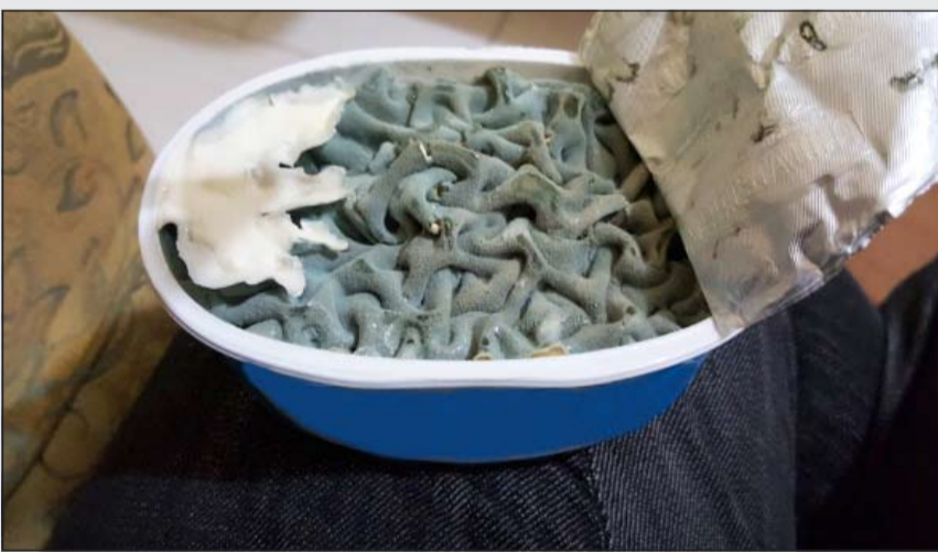
علبة الجبنة بعد فتحها

ذهبت إليها فالمشهد الذي قامت بتصويره هو مقرر للغاية ومدمشم ولا يمكن تخيله. «أنباء المستهلك» تؤكد على أهمية التأكد من تاريخ الانتهاء وقيام الشركات ضمانا لسلامة