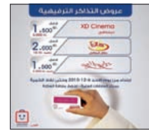
جمعية الروضة وحولي عروض مستمرة

وتشمل العروض حولي بارك بسعر 1,5 دينار ورسيد 5 دنانير، طفل المستقبل بـ 2 دينار ورسيد 10 دنانير، وديسكفري 1,5 دينار ورسيد 3 دنانير.