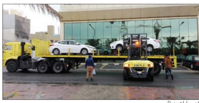
رفع سيارات مهملة