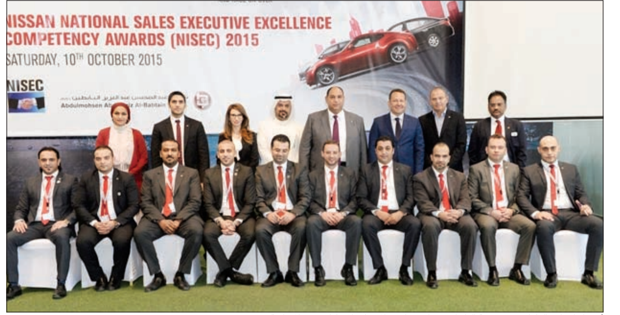
أعضاء الإدارة العليا في مجموعة البايطين مع استشاريي المبيعات المشاركين في المسابقة