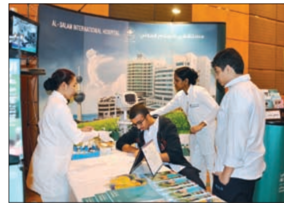
جانب من الفحوصات لرواد المعرض

الفحوصات الطبية خدمات توعوية حول كل ما يتعلق بصحة الطفل واستعرض ما يقدمه من خدمات خاصة داخل أقسامه الطبية