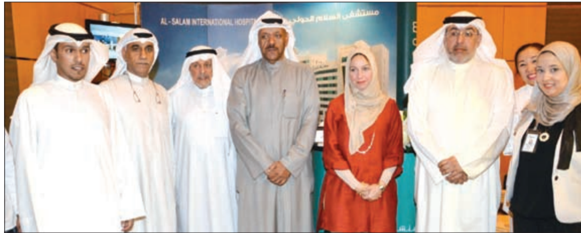
لقطة تذكارية في جناح «السلام الدولي»

إطلاق الأنشطة والمبادرات التي تهدف إلى إثارة الوعي الصحي وتنمية قيم التعاون والمشاركة المجتمعية ومساعدة الآخرين فاطلق العديد من المبادرات وكان آخرها تدشين مبادرة فريدة من نوعها بين المستشفيات الخاصة داخل الكويت لتعليم الأطفال من سن السابعة وحتى الثانية عشرة الإسعافات الأولية الصبغ الماضي، واستفاد منها 200 طفل فيما يطمح المستشفى لاستمرار تلك المبادرة التي توفر تدريبات عملية للأطفال على التعامل مع الإصابات البسيطة التي يتعرضون لها أو أحد زملائهم خلال تجمعاتهم المختلفة.