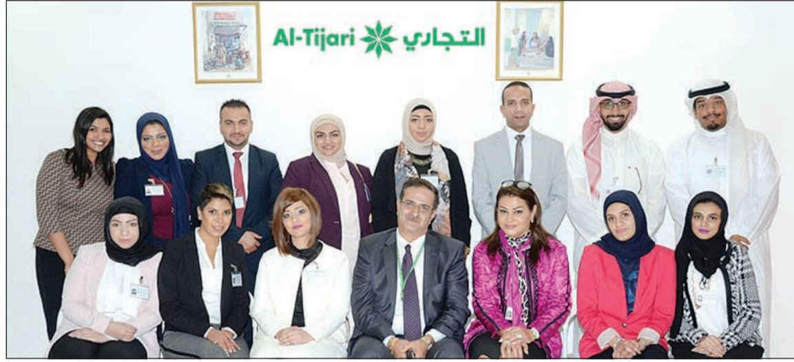
لقطة تذكارية مع المشاركين في البرنامج

المصرفي، لما يتمتع به هذا القطاع من مهنية عالية وتطوير على الصعيد الشخصي والوظيفي بما يواكب احتياجات سوق العمل المصرفي، وشجعهم على بذل أقصى طاقاتهم في العمل من أجل تقديم خدمات تفوق توقعات العملاء.