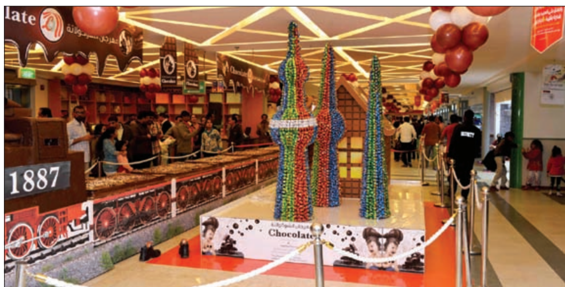
مهرجان الشوكولاتة 2015 من لولو هايبرماركت

أطلق لولو هايبرماركت، أحد أكبر مراكز التسوق الرائدة لبيع الحلويات، عروضه لشهر ديسمبر «مهرجان الشوكولاتة» 2015، حيث يقدم تخفيضات كبيرة على أقدم وأكبر وأشهى أنواع الشوكولاتة. وانطلقت التخفيضات في حضور إدارة لولو والمهنيين في 3 ديسمبر بمنفذ الهايبرماركت في الراي، حيث فوجئ الحضور بحمى العروض في المعروض من أصناف الحلويات ولشاهدة قطار الشوكولاتة البالغ طوله 15 مترا في مشهد أبهر الجميع. وتستمر تخفيضات الشوكولاتة في 2 ديسمبر إلى 12 ديسمبر بجميع منافذ لولو هايبرماركت، وتشمل تنوعا واسعا من منتجات الشوكولاتة الجديرة بالتذوق، وبفضل ما يعرضه المهرجان من مجموعات متنوعة من