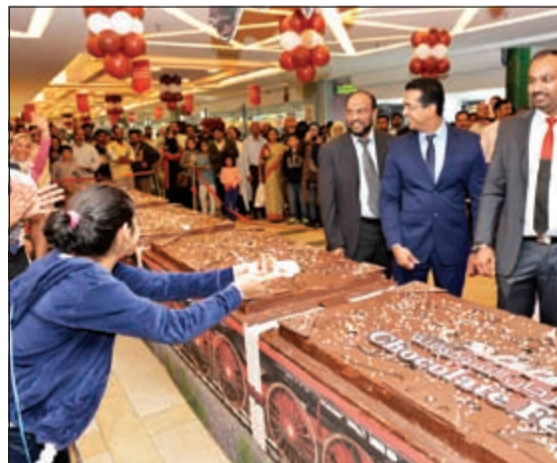
أطول قطار للشوكولاتة في «لولو هايبرماركت»

حيث يعرض أفضل المنتجات بأسعار تنافسية، علاوة على شهرته أيضا بوسائله المبتكرة للتفاعل مع العملاء وإدخال البهجة إلى نفوسهم.