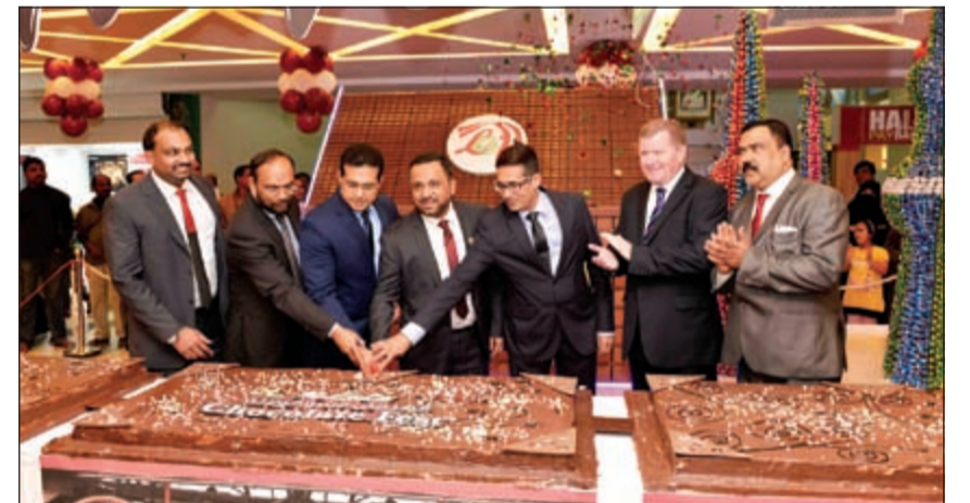
مشاركة بقطع كيكة المهرجان

(ولولو هايبرماركت) مشهور بتخفيضاته الكبرى ومهرجاناته الدورية التي تترك انطباعا مثيرا لدى المستهلكين، ويتبوأ صدارة مراكز التسوق الكبرى،