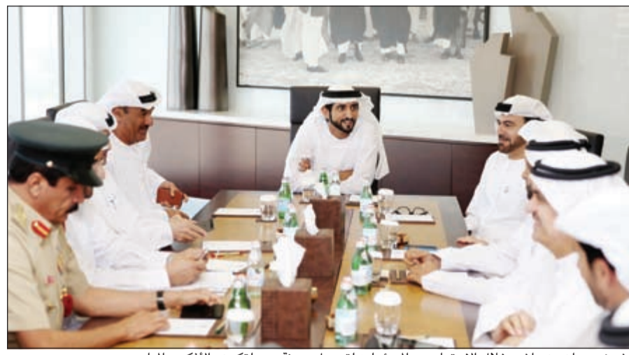
الشيخ حمدان بن راشد خلال الاجتماع مع المسؤولين لتحويل مدينة دبي لتكون «الأذكي عالمياً»

حيث التنفيذ منذ اللحظة الأولى لإطلاق سموه لاستراتيجية تحول دبي لمدينة ذكية قبل عامين. وقد تم إصدار عدد من التشريعات والأطر القانونية إيماناً ببدء مرحلة جديدة من التطور النوعي في الإمارة عنوانها التحول إلى المدينة الأذكي عالمياً، بما يضمن التحول الذكي واستمرارية الإبداع والابتكار في هذه المجال، من خلال منظومة مؤسسية واضحة تشمل القطاعين الحكومي والخاص، تتابعها وتطورها فرق عمل متخصصة لترسيخ مرجعية جديدة في إدارة المدن حول العالم انطلاقاً من دبي.