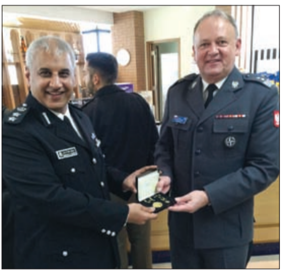
هدية تذكارية للمسفر

ضرورة الاستفادة من الدورات التدريبية لخدمة الوطن وأشارت إلى أن الخالد حيا الضباط الكويتيين الخريجين، متمنياً