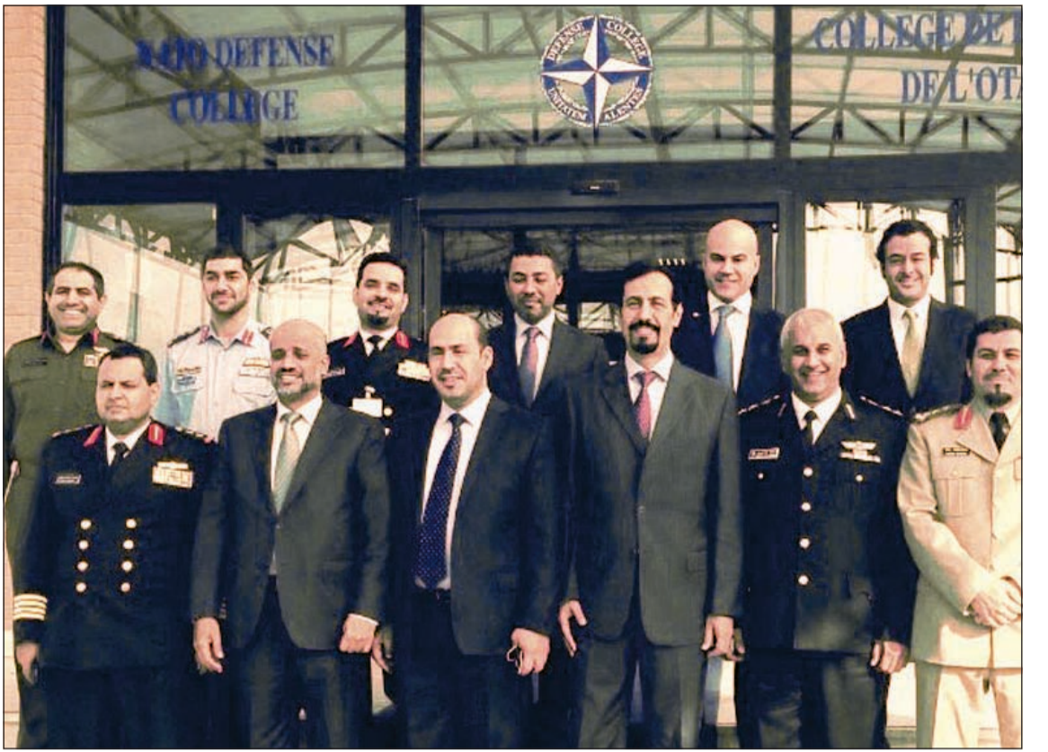
صورة تذكارية للسفير خالد مع الضباط الكويتيين امام كلية دفاع «الناتو»

لمزيد من المعلومات عن القروض تفضل بزيارة: www.e-gulfbank.com/loans أو اتصل على مركز خدمة العملاء 1805805.