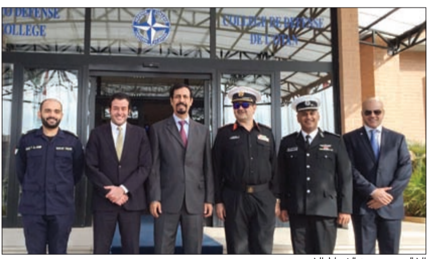
الخالد مع عدد من الضباط الخريجين

وتشكل الدورات الدراسية للتعاون الإقليمي أهم مبادرات حلف الناتو الأكاديمية مع البلدان المتوسطة في «الحوار المتوسطي» و«مبادرة تعاون إسطنبول» ومع البلدان الشريكة في منطقة الشرق الأوسط وهي انبثقت عن قمة ريغا في نوفمبر 2006 بقرار رؤساء دول وحكومات بلدان الحلف بهدف تعزيز حوار أوثق وتعاون مكثف في مجال التعليم.