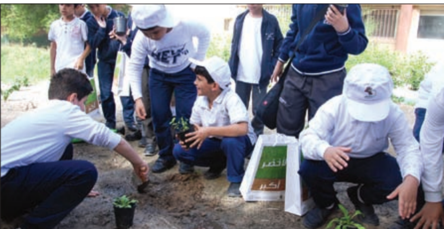
زراعة الشتلات في حديقة مدرسة عبدالعزيز الرشيد الابتدائية

الهيئة العامة لشؤون الزراعة والثروة السمكية قطاع الزراعات التجميلية وبالتعاون مع وزارة التربية إدارة الأنشطة الطلابية بتنظيم الزيارات، وحرص فريق الحملة تحت إشرافها على تنظيم محاضرات تضمنت تعليم الطلبة كيفية الزراعة وأهميتها والفائدة المرجوة منها وحثهم على المبادرة في الزراعة بدءا من بيوتهم إضافة إلى الرد على استفساراتهم المتنوعة حول موضوع التخصيص. لافتة إلى أن فريق الحملة قدم الشتلات للمدارس وشارك الطلبة في زراعتها في الحدائق الخاصة بها، بالإضافة إلى توزيع الهدايا على الحضور. وأضافت أن الحملة لها رسائل هادفة مثل رفع الوعي المجتمعية بالمحافظة على المنتزهات والمرافق العام