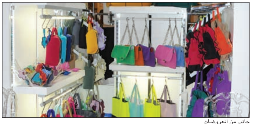
جانب من العروض

المتبرزة تضم حفلا موسيقيا مباشرا، وتوزيع العديد من الجوائز على الحضور وسط أجواء تفاعلية. وتوسع شركة هلا إكسبو للمعارض دائما إلى تنظيم الفعاليات المختلفة والتي تتزامن مع المناسبات المتنوعة وفصول العالم المختلفة، لاسيما ان الشركة نحتت في اطلاق العديد من المعارض مثل معرض هلا رمضان، وهلا تركيا، وكجزء سنوب أفنت. وتهتم هلا إكسبو للمعارض دائما بتطوير وتعزيز تواجدها في السوق الكويتي، وذلك من خلال استقطاب العارضين المتميزين والمنتجات عالية الجودة والشركات المحلية والعالمية، بالإضافة إلى اهتمامها بالتفاصيل الدقيقة المتعلقة بتصميم المعارض