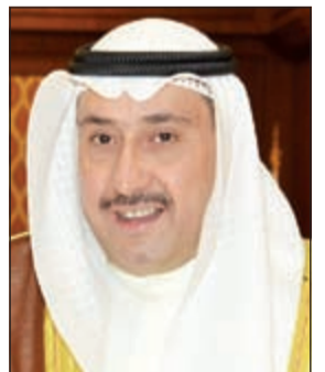
الشيخ فيصل الحمود

يرعى محافظ الفروانية الشيخ فيصل الحمود الملك الصباح مهرجان الخيل الخامس المقام بمضمار المغفور له