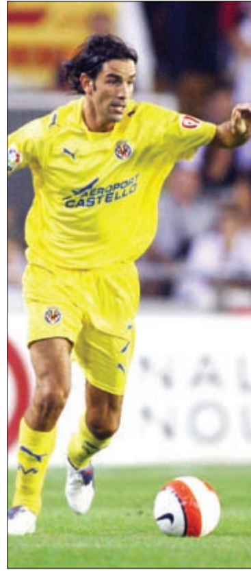
فنتان الفرنسي بيرييس