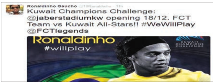
وحساب رونالدنيو يؤكد حضوره

تسابت الصحف المحلية والمواقع المتخصصة على الرياضة وكرة القدم على تناول الأخبار المتعلقة بفعالية ستاد جابر، وتناول بعض الأسماء العالمية المشاركة في الحدث المرتقب، وأبرزها صحيفة الموندو الكاتالونية وكوريير ديللو سبور الإيطالية ووكالة الأنباء الإسبانية وكذلك موقع