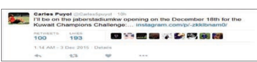
بويول يعلن مشاركته