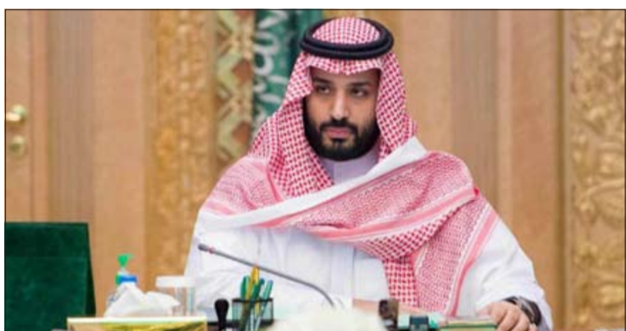
صاحب السمو الملكي الأمير محمد بن سلمان بن عبدالعزيز ولي ولي العهد النائب الثاني لرئيس مجلس الوزراء وزير الدفاع السعودي

وشملت هذه القائمة شخصيات، مثل: المستشارة الألمانية أنجيلا ميركل، والرئيس الروسي فلاديمير بوتين، ووزيرة الخارجية السويدية مارجوت فالستروم، ورئيسة موريشيوس أمينة غريب. وتعد قائمة مجلة «فورين بوليسي» لأهم 100 شخصية في العالم، أهم التصنيفات العالمية للتأثير الشخصي لقيادات وزعماء وسياسيي العالم.