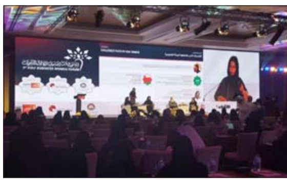
جانب من جلسات العمل خلال الملتقى

لتدريب صاحبات الأعمال الخليجيات على ممارسة الأعمال وتأهيلهن، مشيراً إلى أهمية تشجيع وتحفيز صاحبات الأعمال خاصة الجدد على التميز والتفرد وعدم محاكاة وتقليد مشاريع قائمة. كما أوصى مجلس الاتحاد بتبني إدخال برامج تعليمية لتحفيز الصغار على ممارسة الأعمال منذ المرحلة الابتدائية بالإضافة إلى إصدار موسوعة خليجية متخصصة لصاحبات الأعمال الخليجيات. وأشاد المشاركون بالمبادرة التي أطلقها رئيس اتحاد غرف دول مجلس التعاون رئيس غرفة قطر الشيخ خليفة بن جاسم آل ثاني بتأسيس شركة خليجية لسيدات