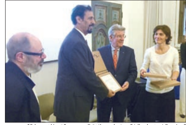
السفير الشيخ علي الخالد يتسلم جائزة الجمهور التي فازت بها الكويت

وهذا السفير الخالد في تصريح لوكالة الأنباء الكويتية (كونا) الكويت قيادة وحكومة وشعبا على هذا النجاح الذي تحقق بتوجيهات من صاحب السمو الأمير الشيخ صباح الأحمد، مشيدا بالجهود التي قام بها وزير الاعلام ووزير الدولة لشؤون الشباب الشيخ سلمان الحمد واللجنة العليا