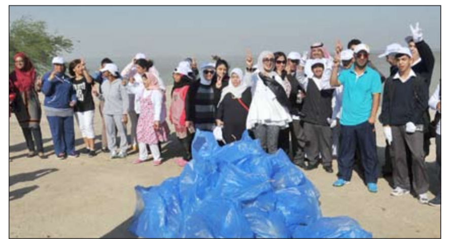
من حصيلة الحملة