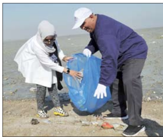
تعبئة المخلفات في أكياس