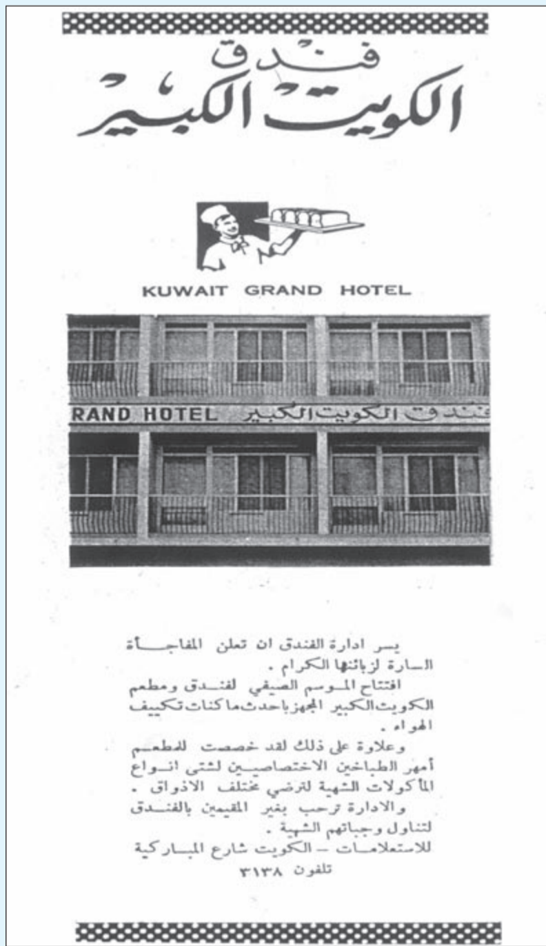
فندق الكويت الكبير

وما يذكر انه قد ورد حول هذا الامر الاميري شعر كتبه الشاعر ابراهيم الخالد الديحاني، وهو شاعر يكتب الشعر النبطي، وله شهرة فيه، وكان رجلا دمث الاخلاق محبوبا بين الناس، وكان نزيها في شعره، محافظا على مكانته، وقد توفي في سنة 1374هـ (1954م)، وهو يقول في قصيدته التي اشرفنا اليها انه دخل الى السوق كجاري عادته، فعجب لمنظر الرجال وهم يمشون فيه بدون ان يلبسوا بشوتهم وتساءل عن السبب في ذلك، فقيل له: هذا عصر جديد قد دخلناه، وهذا هي بدايته، وكانت البداية هي قلع هذه البشوت المكلفة للجميع. ولم يعجبه ذلك فقال مستنكرا: