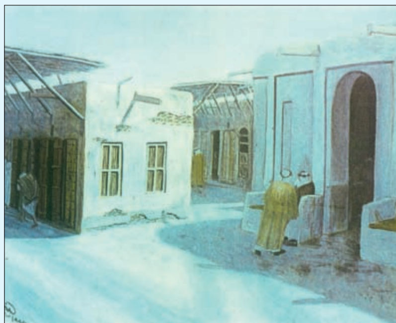
قهوة بوناشي من رسم الأستاذ ايوب حسين