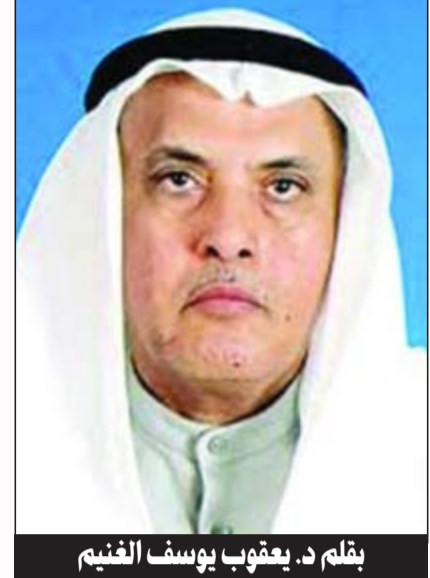
بقلم د. يعقوب يوسف النعيم