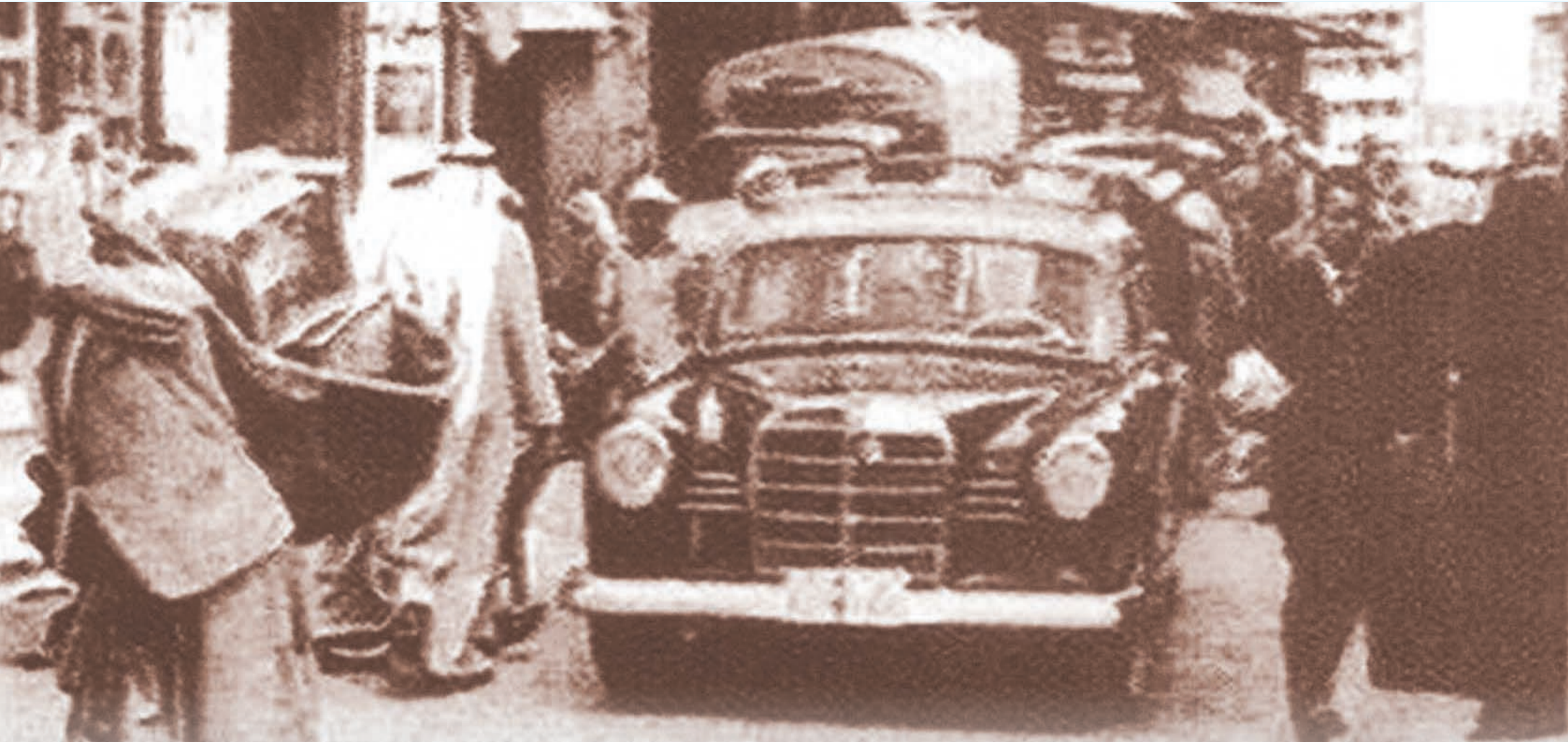
صورة في أحد الشوارع الضيقة في سوق المباركية 1954 ويظهر محل اسمه (ممتاز) وهو أشهر محل تصوير شخصي إيراني

الصفور، والتجارة بها يبعها وشراء، يقع هذا الطريق بين سوق الجت وسوق الغريلي، وقد توقف باعة الصقور - الآن - عن المجيء اليه وعرض صقورهم فيه، ولكنه لا يزال يضم بعض المحلات التي تباع بضائع متنوعة. 12- سوق الغريلي سوق كبير مشهور يمتد من شارع عبدالله غرباً إلى ساحة الصرايف شرقاً. وبه عدد كبير من المحلات التجارية التي تباع بضائع مختلفة ليس منها شيء من المأكولات. ولا يزال محافظاً على وضعه وعلى اسمه.