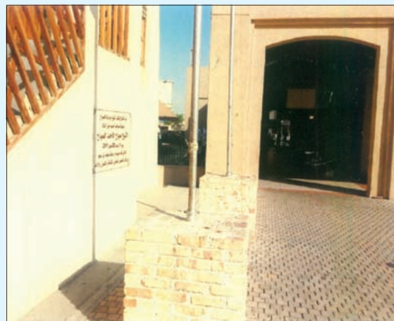
إلى اليمين سوق جديد على انقاض السوق القديم وإلى اليسار طرف من كشك الشيخ مبارك