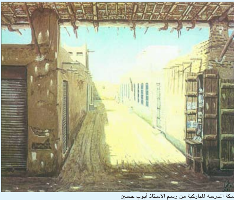
سكة المدرسة المباركية من رسم الأستاذ أيوب حسين

العمل بالصرافة من الأعمال المهمة في الكويت تبرز أهميتها التجارية الواسعة بين الكويت وغيرها من البلدان، وكثرة