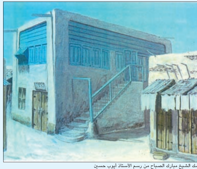
كشك الشيخ مبارك الصباح من رسم الأستاذ أيوب حسين