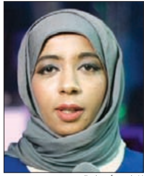
المبادرة أسماء العتيق