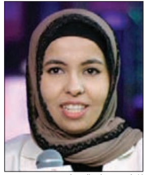
المبادرة جنان الشهاب