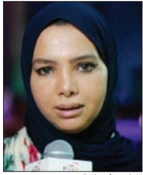
المبادرة أسماء العززي