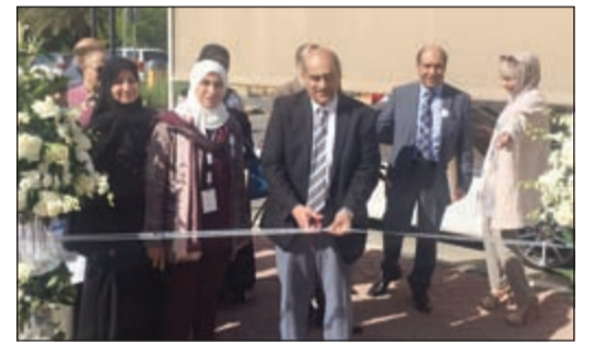
افتتاح أنشطة أسبوع الطب النووي