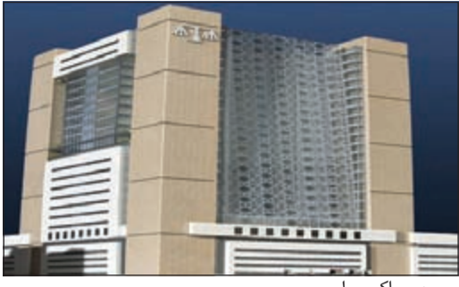
مجمع محاكم حولي