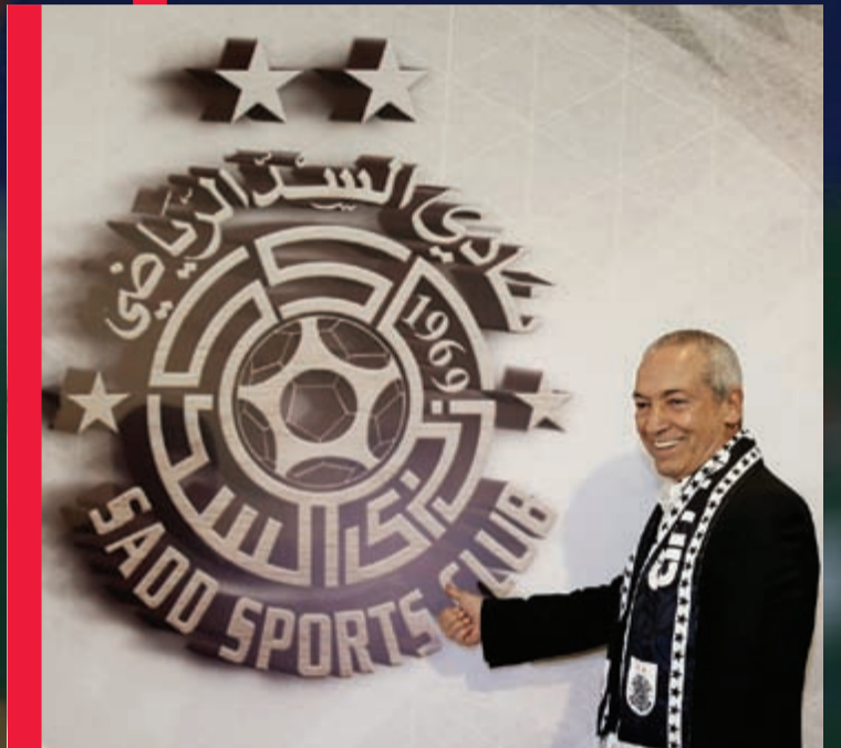
المدرّب البرتغالي بجانب شعار السد