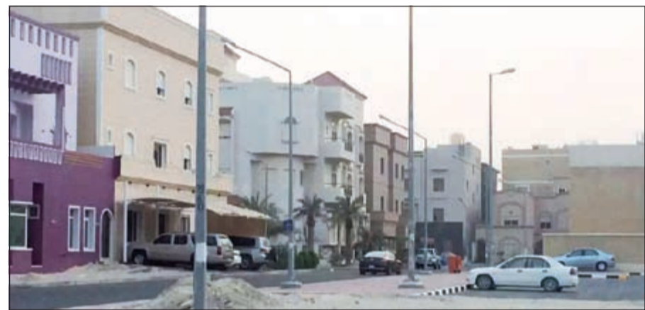
قطاع السكن الخاص مازال يعاني قلة العرض وتزايد الطلب

كونا: قال تقرير «المرشد العقاري» الصادر عن اتحاد العقارين الكويتيين إن قطاع السكن الخاص في الكويت مازال يعاني قلة العرض وتزايد الطلب، مما أدى إلى ارتفاع كبير في الأسعار خلال السنوات القليلة الماضية. وأضاف التقرير بأن هناك ارتفاعاً كبيراً في أسعار أراضي السكن الخاص خلال السنوات السبع الماضية، حيث بلغ متوسط سعر المتر المربع عام 2007 نحو 334 ديناراً، ليقتفز إلى 698 ديناراً للمتر عام 2014 أي ما يعادل ارتفاعاً بنسبة 109%.