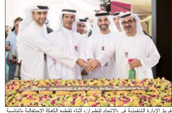
فريق الإدارة التنفيذية في «الاتحاد للطيران» أثناء تقطيع الكعكة الاحتفالية بالمناسبة