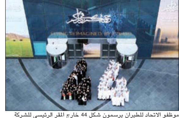
موظفو الاتحاد للطيران يرسمون شكل 44 خارج المقر الرئيسي للشركة

المناسبات بالنسبة الى دولة الإمارات العربية المتحدة، وهي مناسبة اليوم الوطني الرابع والأربعين. تكرر تأسيس اتحاد إماراتنا السبع. وتابع: نتذكر اليوم بكل فخر واعتزاز مؤسسي دولة الإمارات العربية المتحدة الذين اجتمعوا يوم الثاني من ديسمبر 1971 الذي شهد ميلاد دولة الإمارات العربية المتحدة. وإنني سعيد برؤية زملائي وأصدقائي من المواطنين والوافدين يستمدون الإلهام من «روح الانصاح». وعلى مدار أسبوع، قامت أقسام الشركة في المقر الرئيسي للاتحاد للطيران بتزيين المكاتب احتفالاً باليوم الوطني الإماراتي، ليعبروا وبذلك عن الروح الوطنية ويشاركوا في فعاليات واحتفالات الشركة. كما تم أيضاً تنظيم عدد من المسابقات بين الموظفين في إطار الاحتفالات مثل مسابقة مواهب، تحمل الطابع الإماراتي، ومسابقة أفضل رزي إماراتي وأفضل زينة لليوم الوطني على مستوى الأقسام.