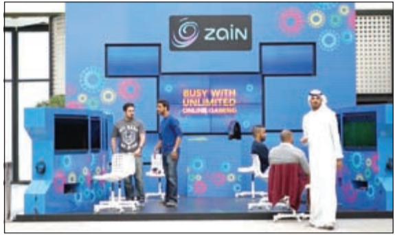
جناح حملة «زين» في «الأقفنيوز»

اطلقت زين، الشركة الرائدة في تقديم خدمات الاتصالات المتنقلة في الكويت، حملتها التسويقية لعشاق ألعاب الفيديو عبر الإنترنت تحت عنوان «الرجاء عدم الإزعاج»، والتي تقدم من خلالها باقات إنترنت LTE-A عالية السرعة، وأجهزة Playstation 4 مجاناً وحصرياً خلال فترة الحملة. وذكرت الشركة في بيان صحافي أنها دشنت الحملة الجديدة في مجمع الأقفنيوز منذ 26 نوفمبر الماضي وتستمر حتى 5 الجاري، مبيحة أن عملاءها وزوار المجمع الشغوفين بألعاب الفيديو عبر الإنترنت مدعوون لزيارة جناحها الخاص في مجمع الأقفنيوز - مرحلة الفراند أقفنيوز - خلال هذه الفترة، والذي ستقدم من خلاله تجربة حية، مع اختبار عملي لأعلى السرعات على شبكتها الأحدث