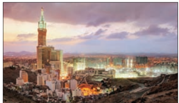
لقطة للفندق من الخارج

جزءاً من الاحتفالات المتنوعة التي تقام بمناسبة ذكرى «يوم ايه مرسيه» السنوية الـ 185 يستضيف رواد صناعة الساعات معرضاً في مول 360 الأشهر في الكويت، يقام هذا المعرض بالتعاون مع شركاء التجزئة الحصريين ليوم ايه مرسيه