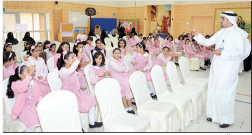
جانب من المحاضرة

الكويت، واصفا الزيارة إلى المدرسة بالخبرة، نتيجة لتفاعل الحضور، الذين أبدوا من جانبهم الاهتمام الكبير بمعرفة المزيد عن منتجات وخدمات البنك وطبيعة العمل المصرفي المتوافق مع أحكام الشريعة الإسلامية. يذكر أن لهذه الشريحة من الطلاب يكثف نشاطه في