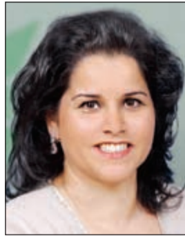
الشبيخة نوف سالم العلي الصباح

الجديد ينتظر ويتربص عملاء وغير عملاء البنك التجاري الكويتي إصدار البنك لرنزنامته السنوية التي دائماً ما تشكل فصلاً جديداً أو تتمحور حول فكرة رئيسية مرتبطة بإحياء التراث الكويتي القديم الغني بالعديد من المعاني والعبر. ومن هذا المنطلق فإننا في البنك التجاري الكويتي نجد العهد باصدار رزنامة عام 2016 وهي مسؤولية يتبناها البنك منذ وقت طويل في العديد من إصداراته التي حملت في طياتها وعبرت بصدق عن صور وأصناف مختلفة لحياة الرعي الأول من أهل الكويت.