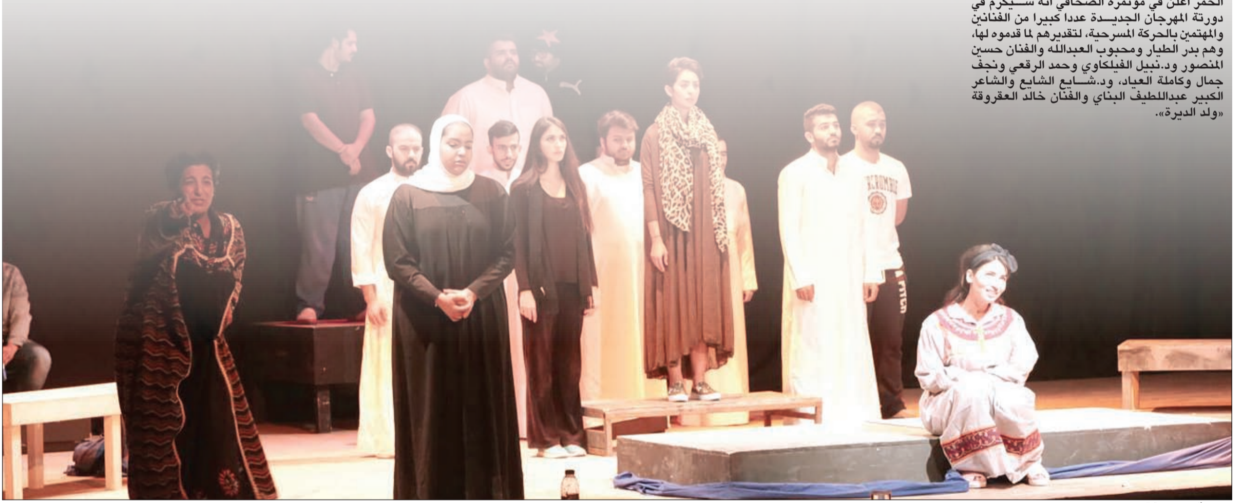
من بروفاة مسرحية العرس