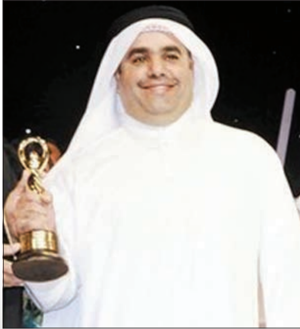
هاني النصار.. هل يكرر إنجازاته في حصد الجوائز؟