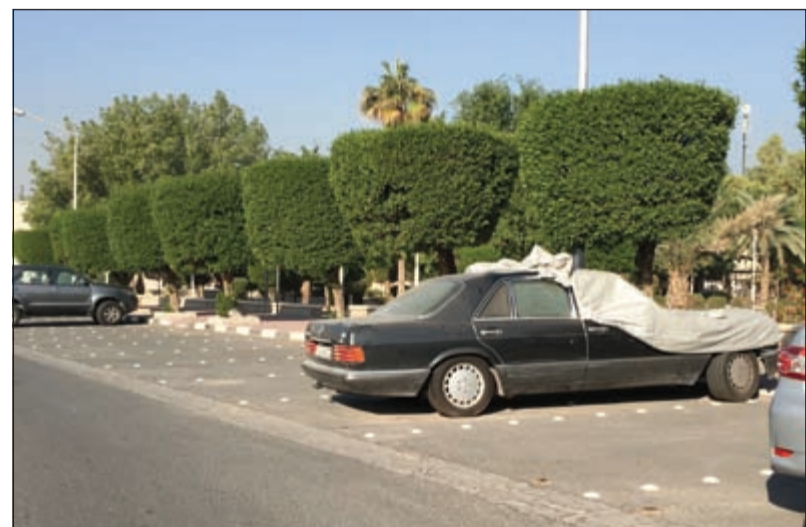
السيارات المهملة تثير استياء اهالي المنطقة