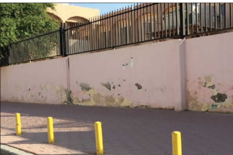
سور إحدى المدارس بحاجة الى ترميم