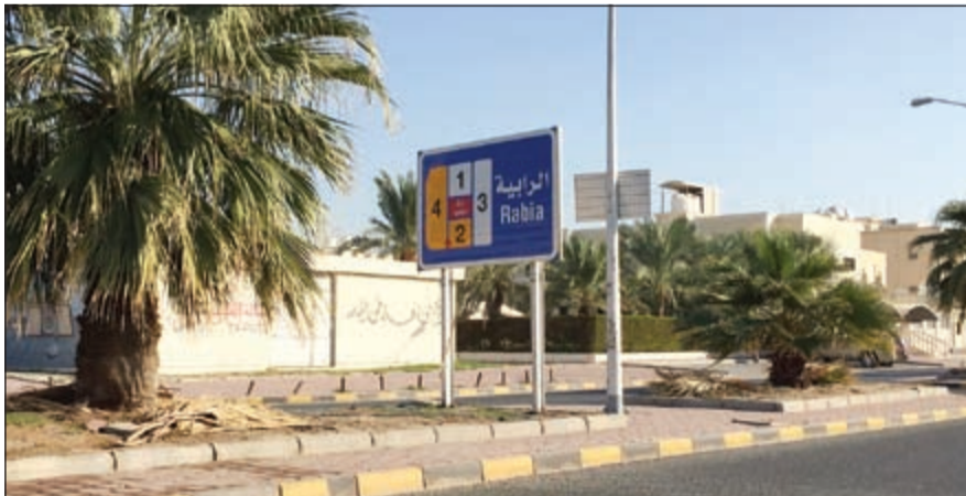
الراية تعاني نقصا في العديد من الخدمات