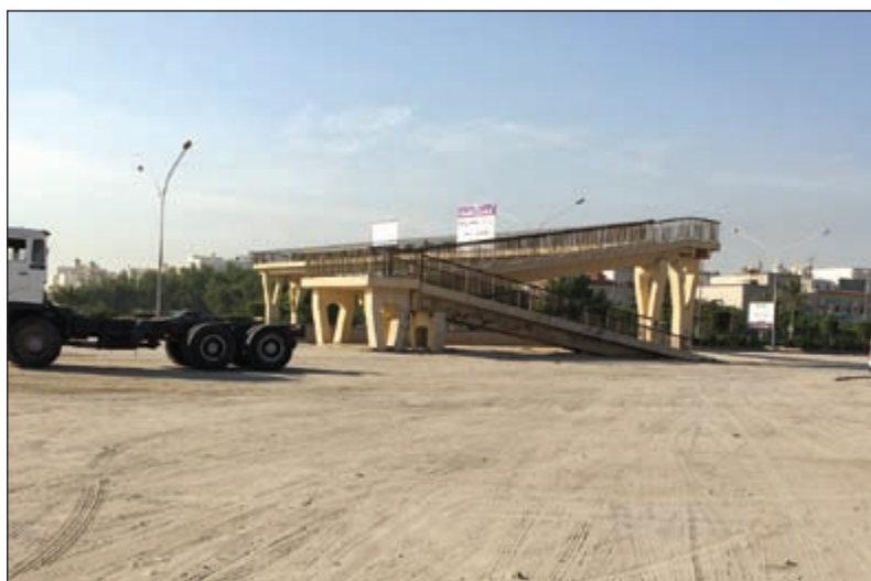
ضرورة تطوير وتأهيل الساحات الترابية