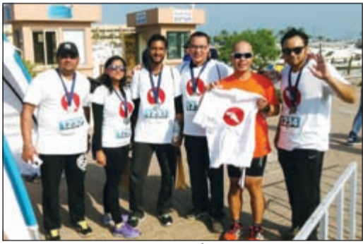
فريق ذي أثلينس فوت مشاركا في السباق

تأكيدا على دورها الخيري والتزامها المجتمعي المتواصل، أعلنت شركة علي عبدالوهاب المطوع التجارية عن رعاية إحدى علاماتها التجارية «ذي أثلينس فوت» لسباق «RunQ8» الخيري الأكبر الذي نظّمته مؤسسة «فوزية السلطان للعلاج الطبيعي والتأهيل الصحي» لمساعدة «مركز تقييم وتأهيل الأطفال»، «CERC».