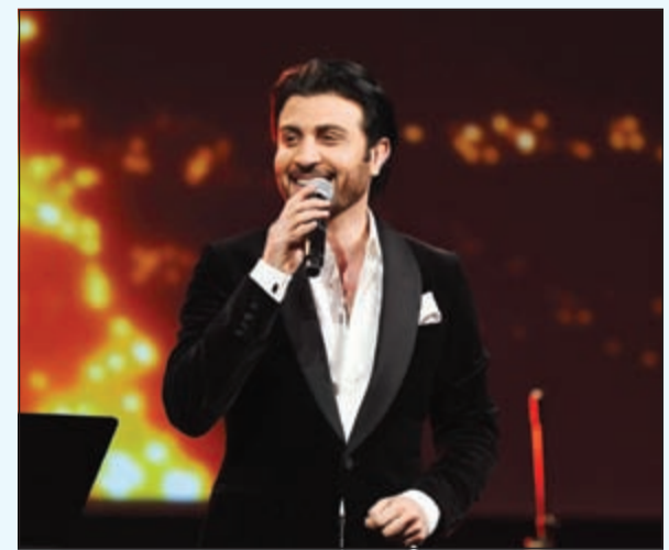
الفنان ماجد المهندس خلال الحفل

استمتع نحو 300 طالب وطالبة غصت بهم أكبر قاعات فندق هيلتون - سان دييغو بحفل الختام الذي أحياه الفنانان مطرف المطرف وماجد المهندس. وقد اضطر مئات الطلاب الآخرين للوقوف خارج القاعة التي امتلأت بالكامل.