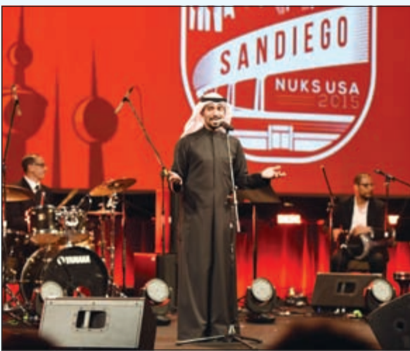
الفنان مطرف الطرف يقدم وصلته الغنائية