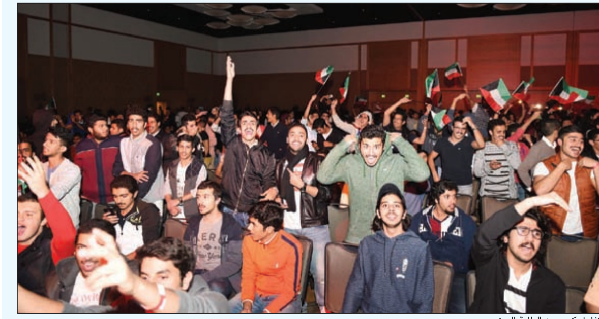
تفاعل كبير من الطلبة الحضور

استمتع نحو 300 طالب وطالبة غصت بهم أكبر قاعات فندق هيلتون - سان دييغو بحفل الختام الذي أحياه الفنانان مطرف المطرف وماجد المهندس. وقد اضطر مئات الطلاب الآخرين للوقوف خارج القاعة التي امتلأت بالكامل.