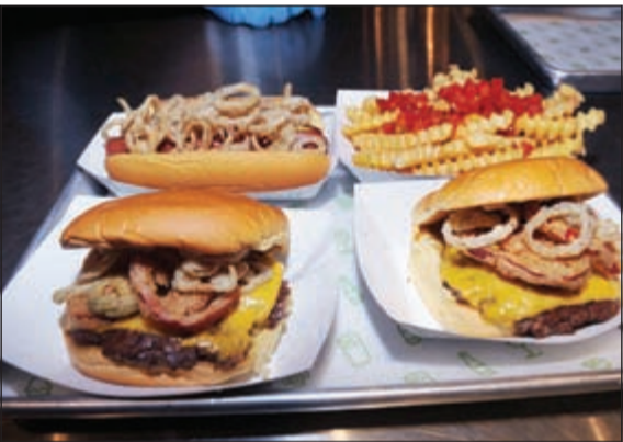
اصناف جديدة من شيك شاك