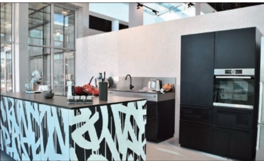
جانب من تجهيزات المطبخ الجديدة من «نولتي نيو»

الطبخ وتتيح للمستهلكين حرية الاختيار، كما تلبي جميع احتياجاتهم بدءاً من الخزائن المطبخية وصولاً إلى أفران الطبخ.