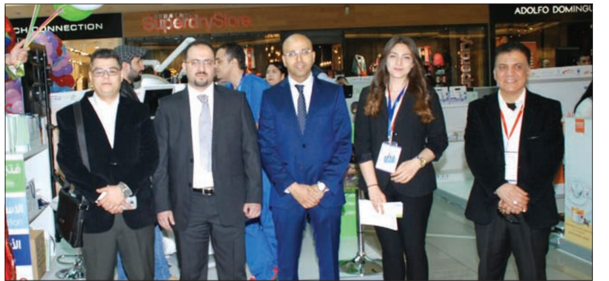
جانب من معرض الصحة والتجميل