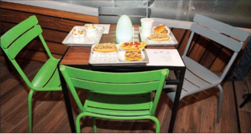
جودة عالية وأفضل الأسعار

بدعوة من إدارة فندق وريزيدنس سفير الكويت - الفنطاس، اجتمعت الأسرة الصحافية والإعلامية الشهر الماضي في مطعم الروشنة للمأكولات الكويتية التقليدية، يليها الاستمتاع بجلسة الخيمة الملكية المكيفة في حديقة الشاطئ التي تحيط بها مساحات خضراء واسعة ممتدة على الرمال الذهبية للخليج العربي حيث يوفر لأفراد الأسرة الصحافية والإعلامية فرصة الاسترخاء والتلذذ بنفحات الشبشة التقليدية المفضلة لديهم في قلب المناظر الطبيعية مما يتيح لضيوفنا الكرام التمتع والترفيه عن أنفسهم في بيئة مريحة وفاخرة. وجاءت الدعوة تقديراً وامتناناً من إدارة الفندق للصور الداعم والفعال الذي تلعبه الصحافة