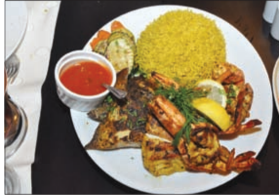
من الأطباق المقدمة