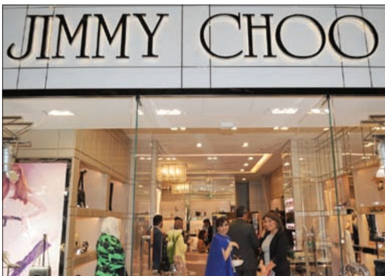
فرع «جيمي شو»... وتشكيلات متميزة من الأحذية (قاسم باشا)