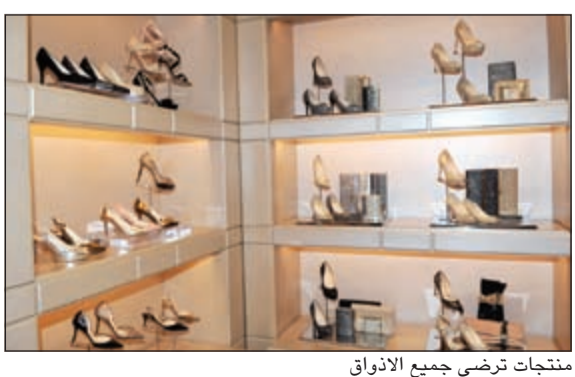
منتجات ترضي جميع الذواق