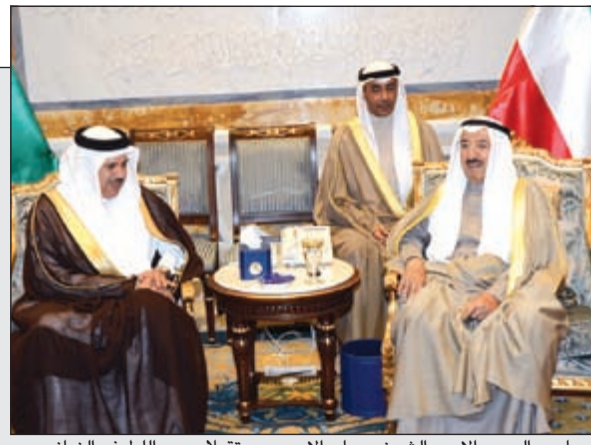
صاحب السمو الامير الشيخ صباح الاحمد مستقبلا د.عبداللطيف الزياتي