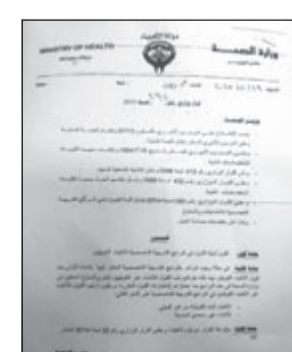
صورة زكوغرافية للقرار

لأطباء البشري والأسنان غير الكويتيين العاملين في وزارة الصحة بهذه البرامج بعد اجتيازهم اختبارات القبول المقررة، ويكون قبول الأطباء غير الكويتيين بداية من أبناء الكويتيات ثم البدون. وقال مصدر مسؤول لـ «الأنباء» ان الوزارة بحاجة في الوقت الحالي إلى عدد كبير من الأطباء، نظراً للتوسعات والافتتاحات التي تشهدها الوزارة في مختلف مناطقها الصحية بقبولها نقص في الدرجات الوظيفية مثل هذه الوظائف.