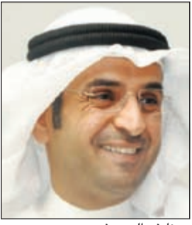
د. نايف الحجرف