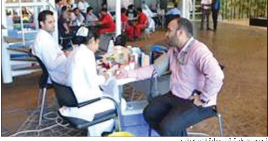
فحوصات طبية قبل عملية التبرع بالدم

موظفوها هي جزء من سلسلة الأنشطة السنوية التي تنظمها موظفيها وكوادرها لتحفيزهم على العطاء وتشجيعهم على الإقبال على الأنشطة التي تخدم المجتمع، وبينت أن الإقبال الكبير الذي شهدته هذه الحملة من قبل الموظفين فخر لها ولكوادرها على جميع المستويات. وأعرب المشاركون عن سعادتهم الفائقة بهذه المبادرة الإنسانية وامتنانهم لبك الدم وتعاونها مع المؤسسات الوطنية.