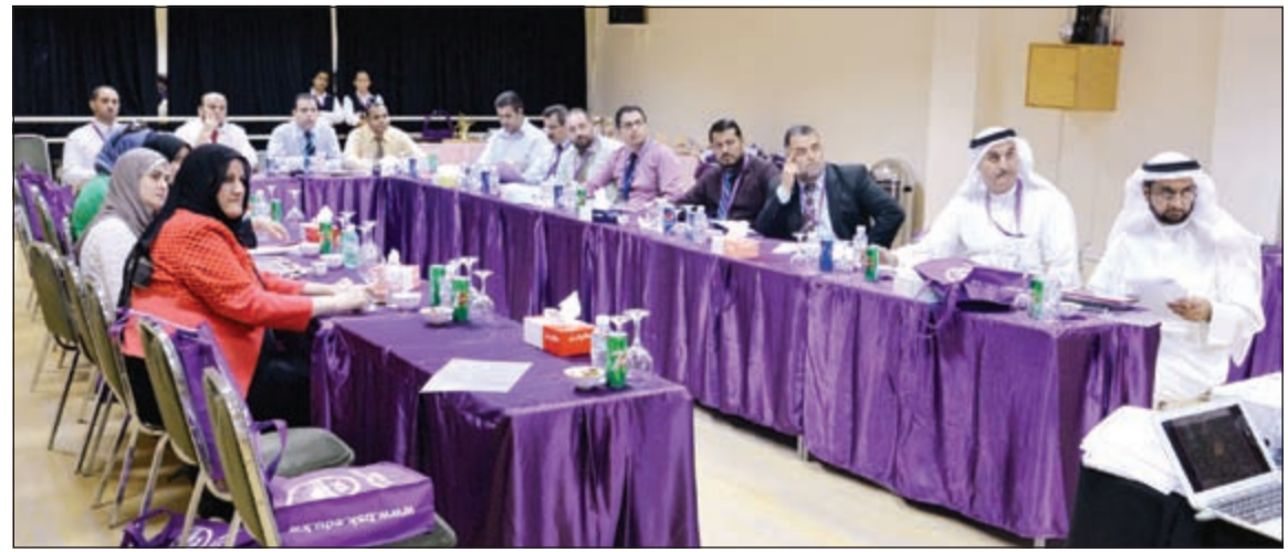
جانب من ورشة عمل استخدام الآيباد في المدرسة البريطانية بالكويت

المقدمة والتي من شأنها التأكيد على فاعلية التطور وفق المستجدات التكنولوجية الحديثة.