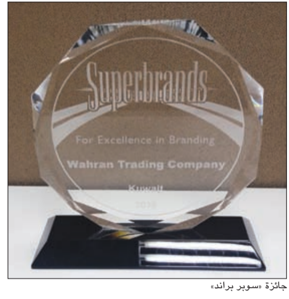
جائزة «سوبر براند»

والريادة المتواصلة، وتأكيدا لإستراتيجيتها للبقاء دوماً في مقدمة الشركات التي تحافظ على المعايير والمقاييس العالمية للجودة في جميع أقسامها. ويعد مجلس «سوبر براندز» أكبر هيئة عالمية مستقلة معنية بالعلامات التجارية إذ يضم عددا من الشخصيات البارزة في هذا المجال، ويسعى المجلس إلى تكريم العلامات التجارية الرائدة دوليا كما يصدر مجموعة من المطبوعات التي تسلط الضوء على العلامات التجارية الحاصلة على تقدير «سوبر براند» في مختلف أنحاء العالم.