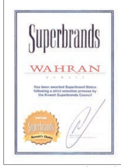
شهادة سوبر براند