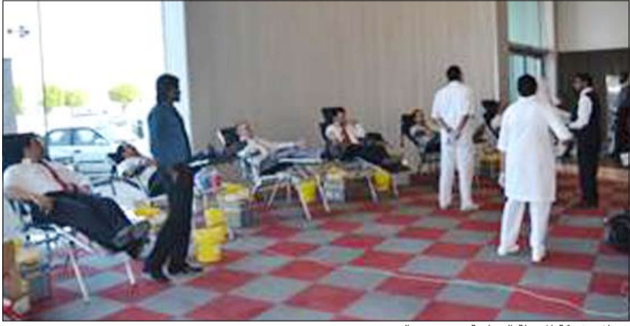
موظفو شركة المسيلة التجارية يتبرعون بالدم