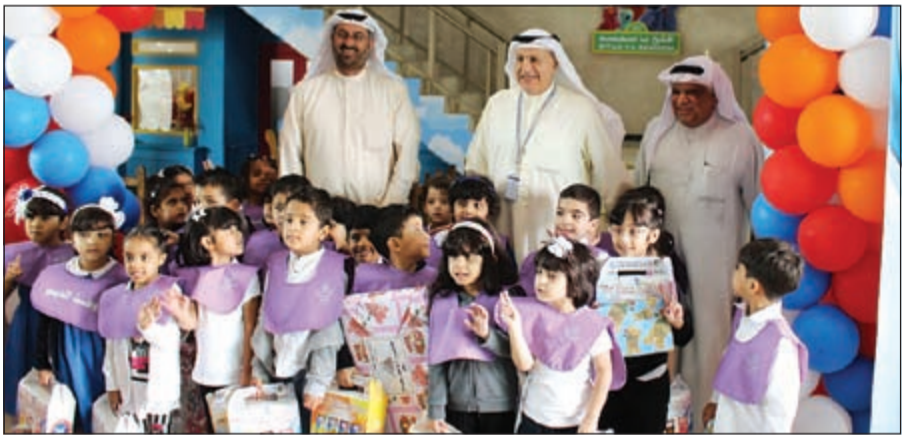
لقطة تذكارية مع عدد من الأبناء المشاركين