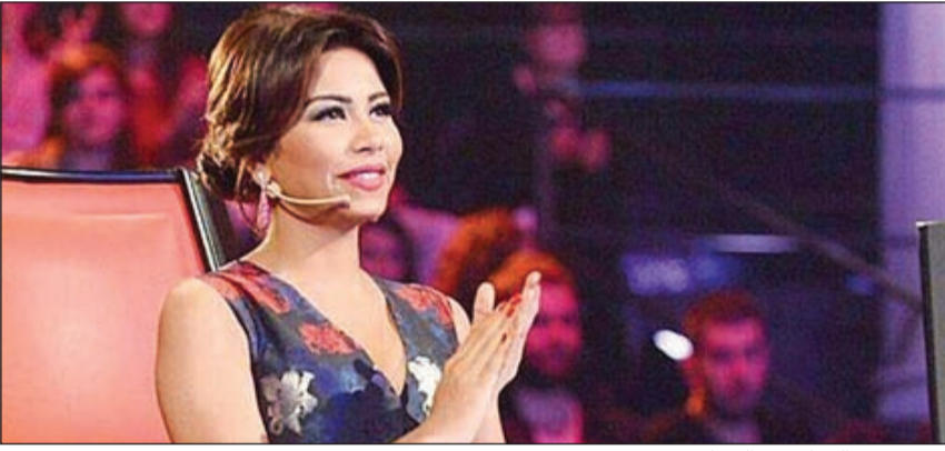
شيرين عبدالوهاب في البرنامج

وأكدت شيرين أنها لن تجامل في اختيار موهبة لأسباب شخصية، خاصة أنها تعلم جيداً - حسب قولها - من يصلح من فريقها للبقاء في الفترة الحالية، أما في الحلقات المقبلة فالرأي سيكون بتصويت الجمهور، مع خالص احترامها لزملائها وأخوتها أعضاء لجنة تحكيم البرنامج والعاملين وكذلك قناة MBC، موجهة خالص حبها للمشتركين من كل الجنسيات وكافة الشعوب العربية.