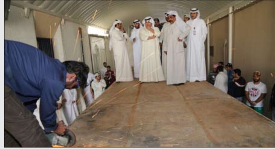
قيادات الداخلية أثناء عملية اخراج المضبوطات