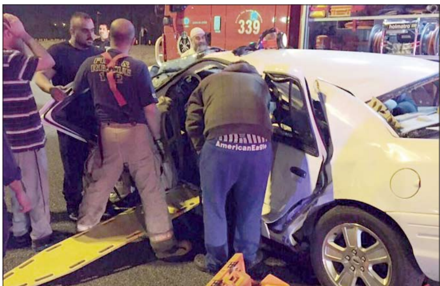
رجال الاطفاء يقومون باخراج شخص انحسر بداخلها