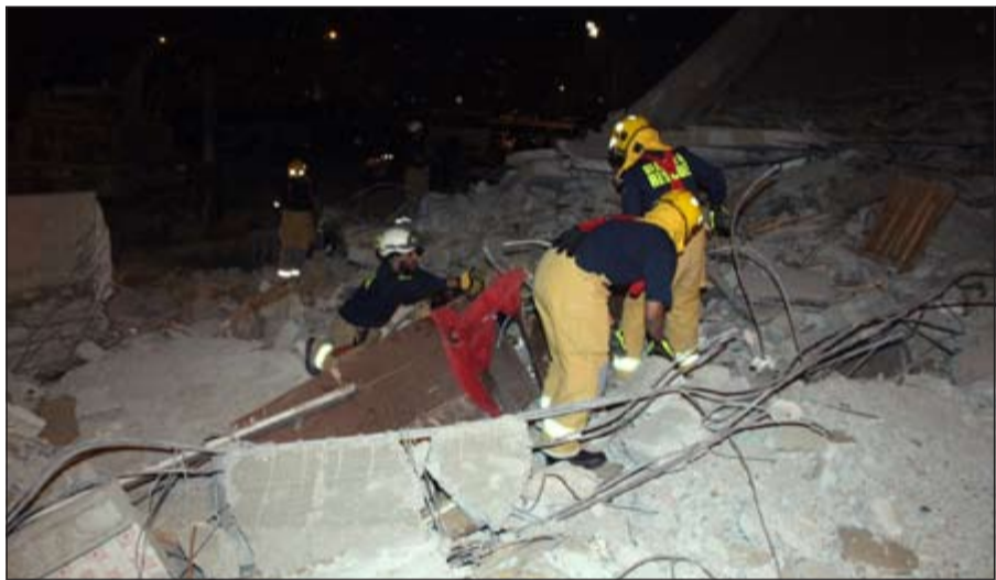
رجال الإنقاذ يبحثون عن ضحايا تحت الأنقاض

ان بلاغا ورد الى غرفة عمليات الداخلية عن وجود حريق بمركبة في منطقة كيفان فتوجه رجال الأمن والإطفاء الى موقع البلاغ، حيث تم إخماد الحريق الذي رجح المصدر ان يكون سببه تماسا كهربائيا تسبب باشتعال النيران في المركبة.