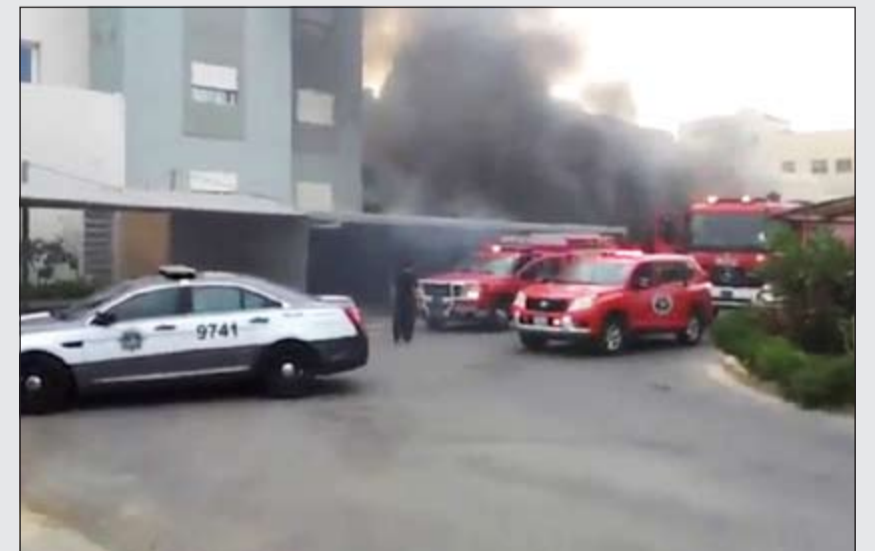
رجال الإطفاء أثناء إخماد الحريق