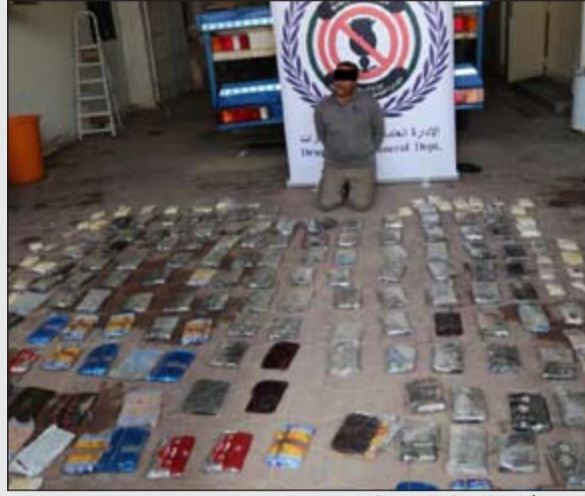
المتهم وأمامه الكمية الضخمة من المخدرات