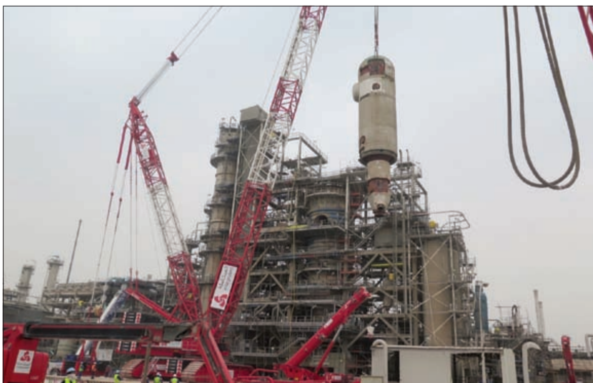
جانب من عملية إززال المفاعل في الوحدة بمصفاة الأحمدى