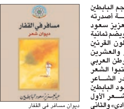
ديوان مسافر في القفار

تقيم كلية دار العلوم بجامعة المنيا في مصر ندوة حول معجم البابطين لشعراء العربية في القرنين التاسع عشر والعشرين، كما تعقد جلسة نقدية لمناقشة ديواني الشاعر عبدالعزيز سعود البابطين «بوح البوادي» و«مسافر في القفار»، وذلك يوم الأربعاء المقبل، وتأتي الندوة تحت عنوان «قضايا الشعر العربي الحديث في ضوء معجم البابطين»، ومواقف: معجم القرنين شعر البابطين نموذجين، وسيناقش مجموعة من الأكاديميين المحاور الآتية: معجم القرنين رؤية نقدية يتناول من خلالها المشاركون قضايا المعجم وشعراءه من حيث عرقياتهم وإيديولوجياتهم التي أشار