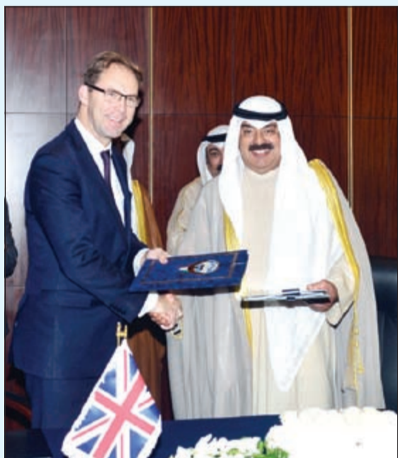
السفير خالد الجارالله ووزير الدولة لشؤون الشرق الأوسط البريطاني توباس الود خلال توقيع اتفاقية تبادل المجرمين والمساعدة القضائية

الأهمية للكويت حيث كنا نتطلع إلى توقيعها من زمن طويل»، وأعرب الجارالله عن اعتقاده أن يكون «موضوع التحدي الأمني» في مقدمة موضوعات وأولويات القمة الخليجية الـ 36 المقرر عقدها في الرياض خلال ديسمبر المقبل، مؤكدا أن الحديث عن التعاون الأمني بين دول مجلس التعاون «تفرسه الظروف والمستجدات والمخاطر والتحديات التي تواجهها دول المجلس».