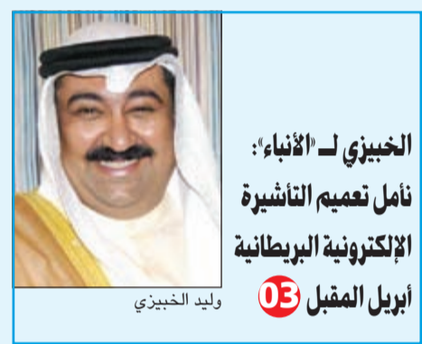
الخبيزي - الأنباء: نأمل تميم التأشيرة الإلكترونية البريطانية أبريل المقبل

أسامة دياب دشن وزير شؤون الشرق الأوسط توباس الود المرحلة التجريبية من النظام الإلكتروني الجديد لإعفاء الكويتيين من التأشيرة، وستستمر هذه المرحلة لمدة شهرين، على أن يكون النظام متاحا لجميع الكويتيين مع مطلع 2016. وأوضح الود، خلال زيارته إلى مركز