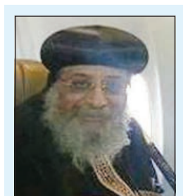
البابا تواضروس الثاني يتوجه للقدس في أول زيارة لرئيس الكنيسة منذ عقود