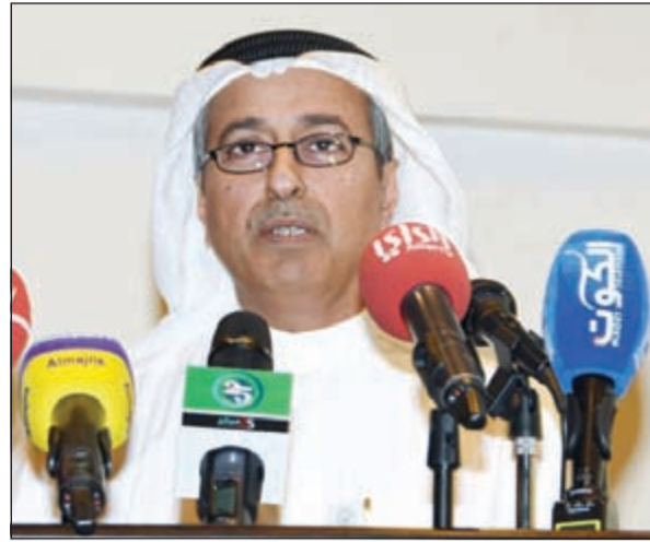
المستشار عادل العيسى يلقي كلمته