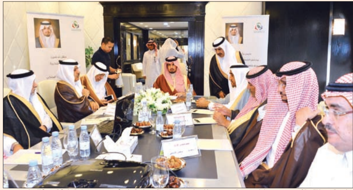
صاحب السمو الملكي الأمير سعود بن سلمان بن عبدالعزيز مترسلاً اجتماع مجلس إدارة الجمعيات التعاونية عقب قبول سموه الرئاسة الفخرية للمجلس

انتشاراً كبيراً داخل المملكة، مبدياً سموه استعداده لبذل الجهد والنهوض بالعمل التعاوني.