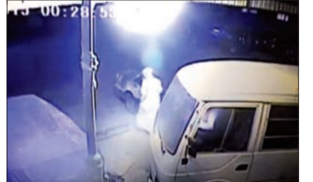
مجهول يشعل النار في الباص