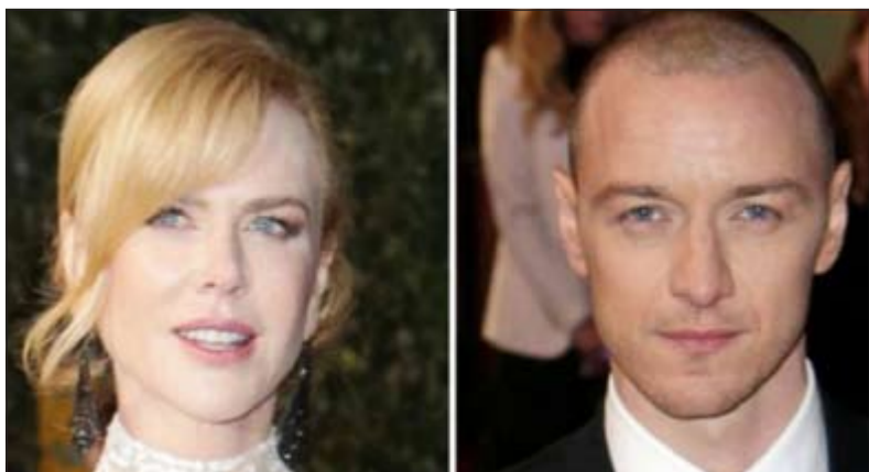
فازت كيدمان لدورها في مسرحية «فوتوغراف 51»، بينما فاز ماكفوي بالجائزة لدوره في مسرحية «ولفينغ كلاس»

وقالت الممثلة إنها قبلت أداء الدور تكريماً لوالدها، وهو عالم توفي عام 2014. وأضافت: «كل ليلة قبل أن أصعد على المسرح، أنحني أمام صورته وأنظر في عينيه ليعطيني القوة على المضي قدماً. أفعل ذلك كل ليلة».