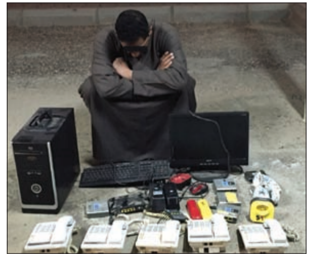
الوافد وأمامه مضبوطات الوكر