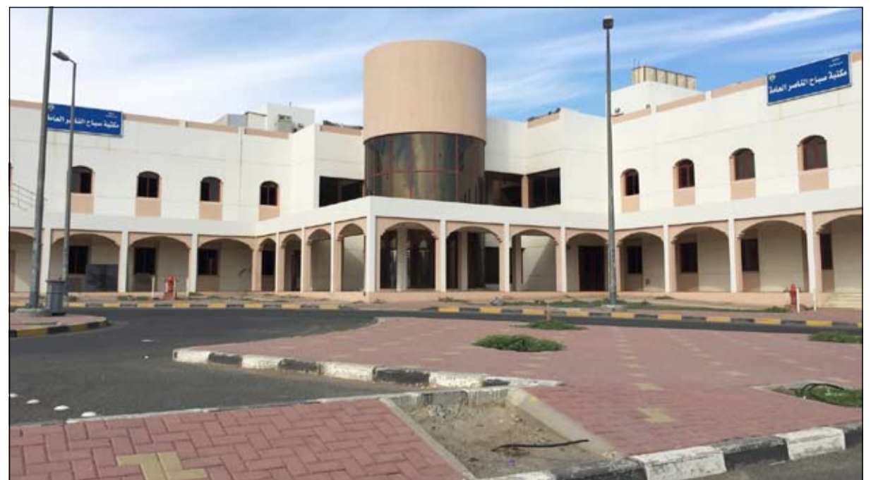
المكتبة العامة في صباح الناصر مهمة منذ 6 سنوات