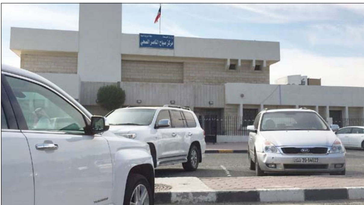
المستوصف الوحيد في المنطقة

سلط رواد ديوانية المنديل الضوء حول مشكلة صحية كبيرة مطالبين وزارة الصحة بأن تنظر فيها وهي أن مستشفى الفروانية أنشئ عام 1980 ووقتها لم يكن لديهم سوى 4 مناطق في المحافظة وقد تم بناؤه تناغماً مع الكثافة السكانية. آنذاك أما الآن فقد تغير الوضع في ظل تنامي عدد المناطق في المحافظة والتي أصبحت كثافتها السكانية مرتفعة، لافتين إلى زيادة عدد القطع في المناطق، فمثلاً منطقة عبدالله المبارك بها 9 قطع تقريبا و4950 منزلاً ومناطق اشيلية والرحاب والعراضية والأندلس بالإضافة إلى منطقة صباح الناصر ذات الـ 7 قطع سكنية، فكل هذه المناطق يراجع سكانها مستشفى الفروانية.