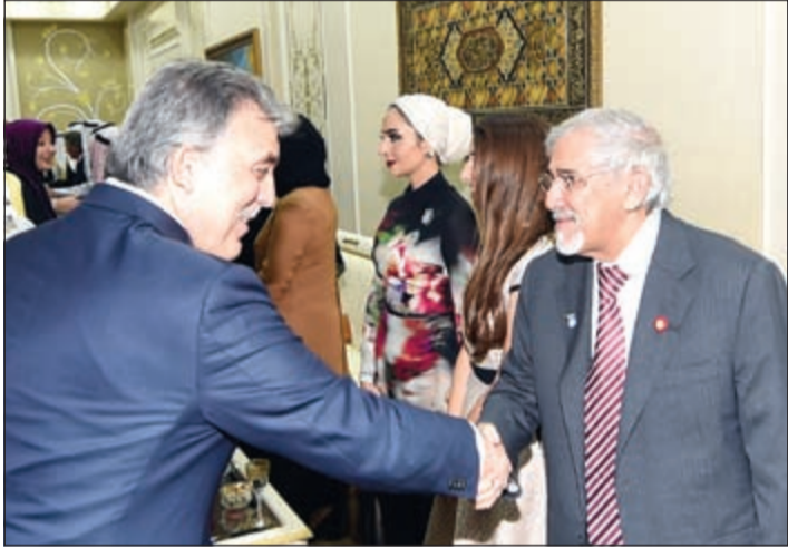
دهلال السايير والرئيس عبدالله غول

أقام سمو الشيخ ناصر المحمد مساء أول من أمس في قصر الشويخ مأدبة عشاء على شرف رئيس جمهورية تركيا الصديقة السابق عبدالله غول والوفد المرافق له بمناسبة زيارته للبلاد.