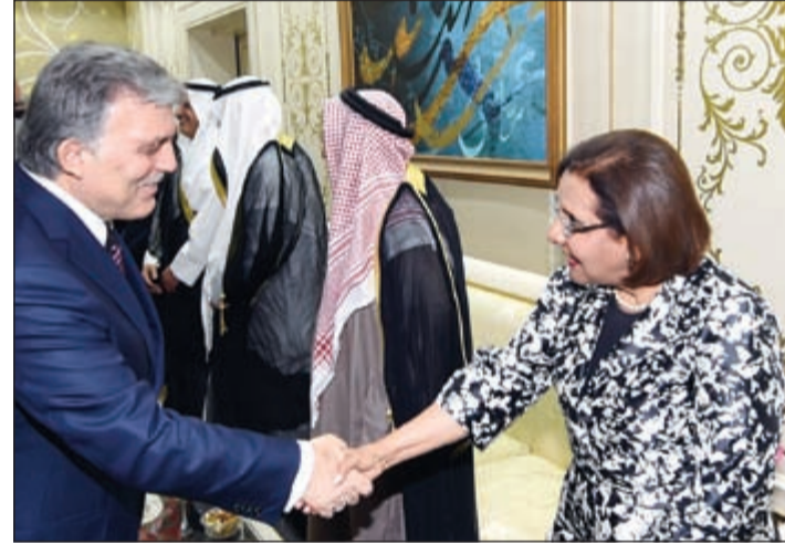
دموضي الحمود مصافحاً الرئيس عبدالله غول