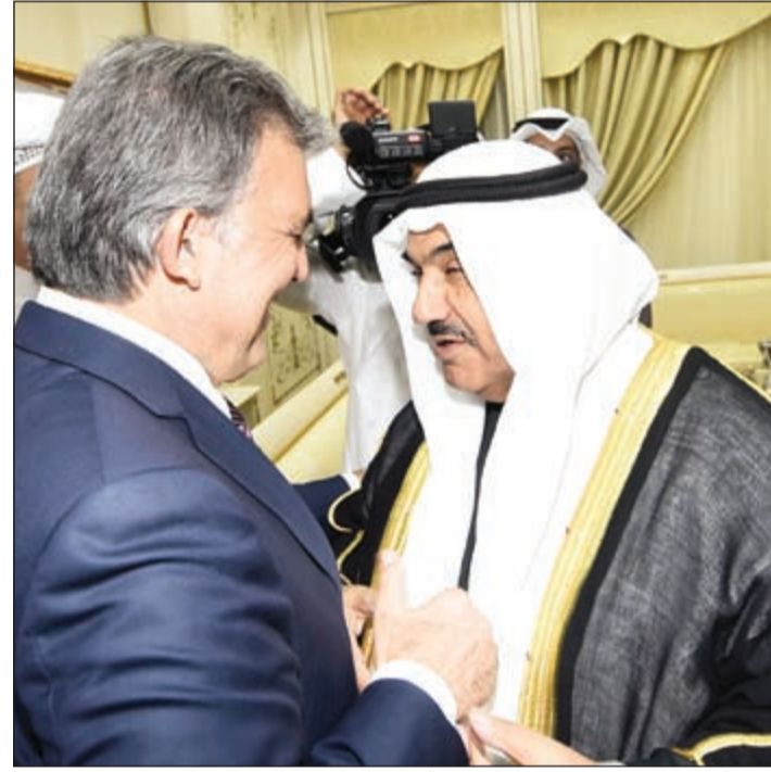
سمو الشيخ ناصر المحمد مرحباً بالرئيس التركي السابق عبدالله غول