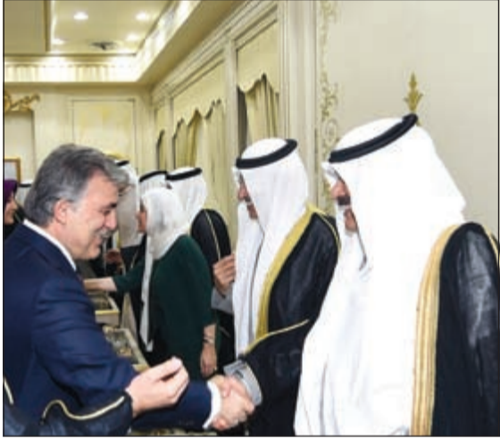
عبدالله غول مصافحاً خالد الجارالله