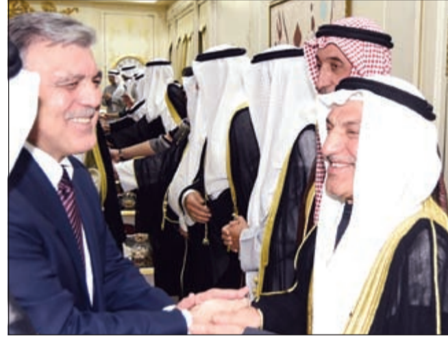
حديث بين المستشار محمد أبو الحسن والرئيس عبدالله غول

أقام سمو الشيخ ناصر المحمد مساء أول من أمس في قصر الشويخ مأدبة عشاء على شرف رئيس جمهورية تركيا الصديقة السابق عبدالله غول والوفد المرافق له بمناسبة زيارته للبلاد.