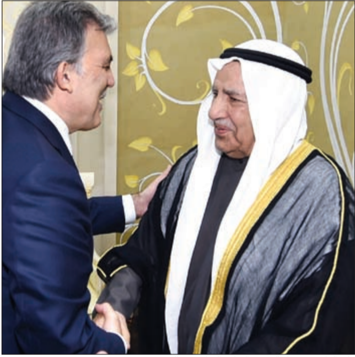
علي الغانم مستقبلاً الرئيس التركي السابق عبدالله غول