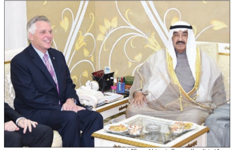
سمو الشيخ ناصر المحمد وحاكم فرجينيا تيري ماكالييف