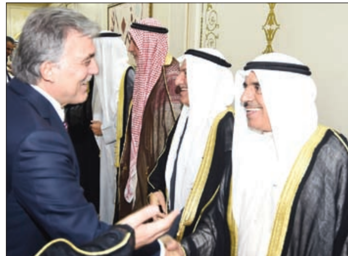
عبدالله غول مصافحاً الحضور