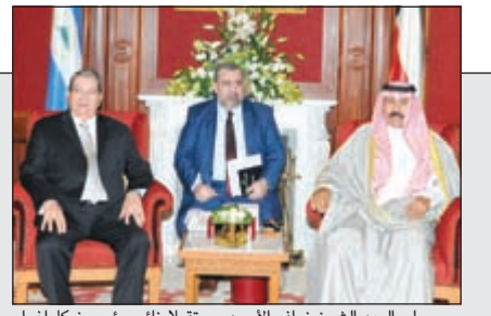
سمو ولي العهد الشيخ نواف الأحمد مستقبلاً نائب رئيس نيكا راغوا

المحمد أقام مأدبة غداء على شرف حاكم 'فرجينيا' الأميركية والوفد المرافق له 08