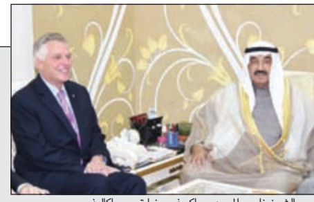
سمو ولي العهد الشيخ نواف الأحمد مستقبلاً نائب رئيس نيكا راغوا