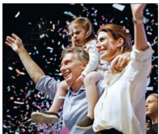
رئيس الأرجنتين الجديد ماوريسيو ماكري يحتفل بالفوز مع ابنته وزوجته اللبانية الأب والسورية الأم

رئيس أفرجنتين ماكري يعد بـ «عصر جديد» وبلا تصفية حسابات