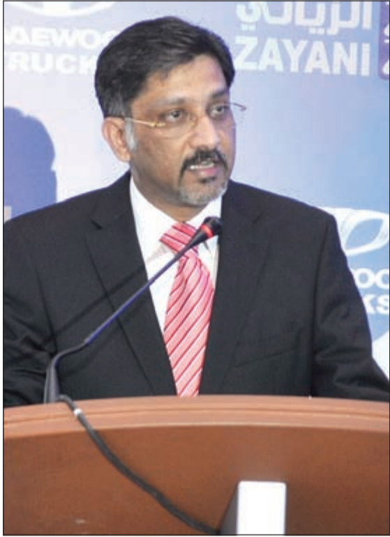
آل فينود ملقيا كلمته

فينود: «تاتا دايو» مستمرة في توسيع خط إنتاج الشاحنات الثقيلة والمتوسطة