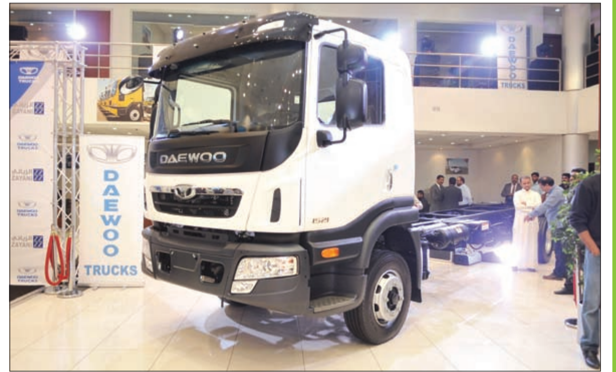
قوة وعزم ومثانة