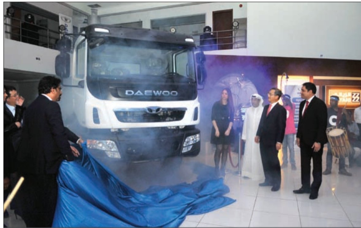
لحظة الكشف عن الشاحنة الجديدة

أطلقت شركة الزياني للسيارات وشركة تاتا دايو موتورز مجموعة جديدة من شاحنات دايو التجارية المتوسطة بمعرض دايو الجديد في منطقة الري، وذلك بحضور لفييف من كبار الشخصيات والعملاء ووسائل الإعلام، حيث