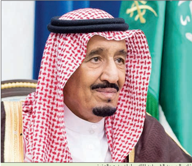
خادم الحرمين الشريفين الملك سلمان بن عبدالعزيز