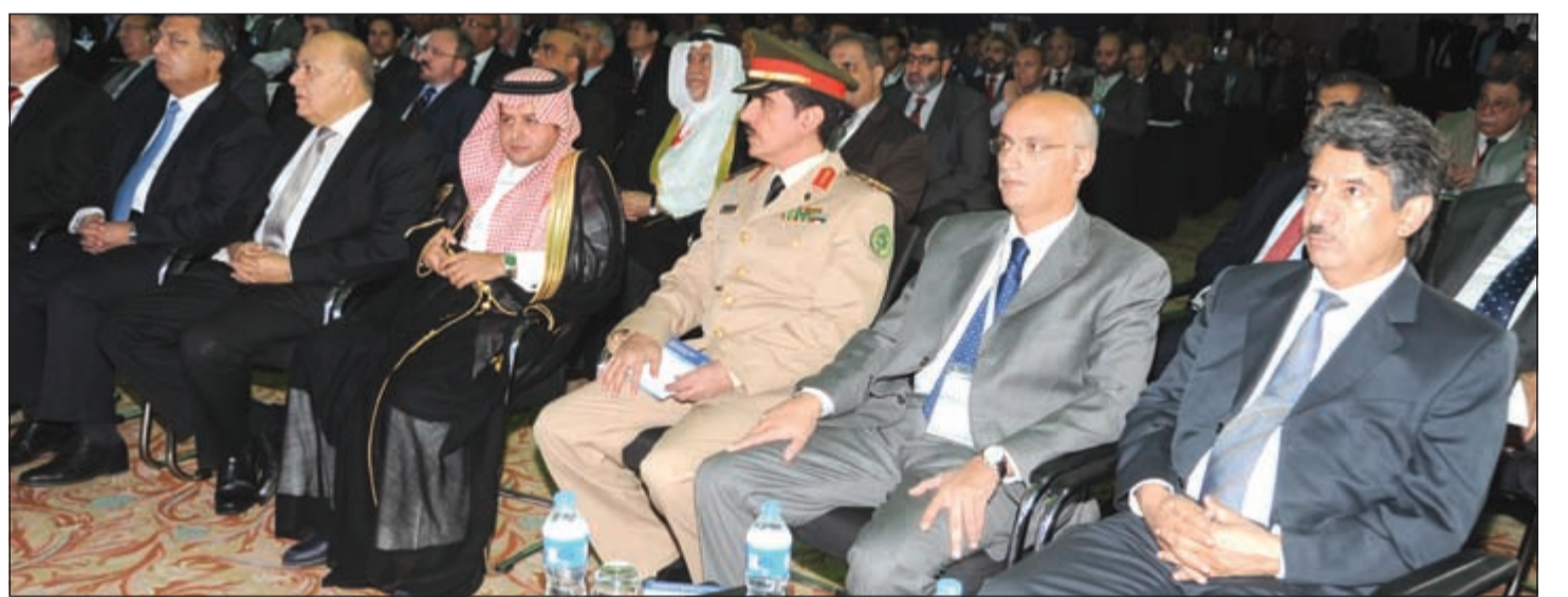
سفير الكويت في القاهرة سالم الزمانان في مقدمة حضور الملتقى

وأضاف أن المجتمعات العربية استطاعت تنفيذ نحو 40% من التوصيات التي خرجت بها الدورات السابقة من ملتقى التشغيل والصيانة، ولدينا هدف زيادة نسبة التنفيذ لهذه التوصيات بما ينعكس على أداء الشركات والكيانات العاملة في هذا المجال داخل البلدان العربية.