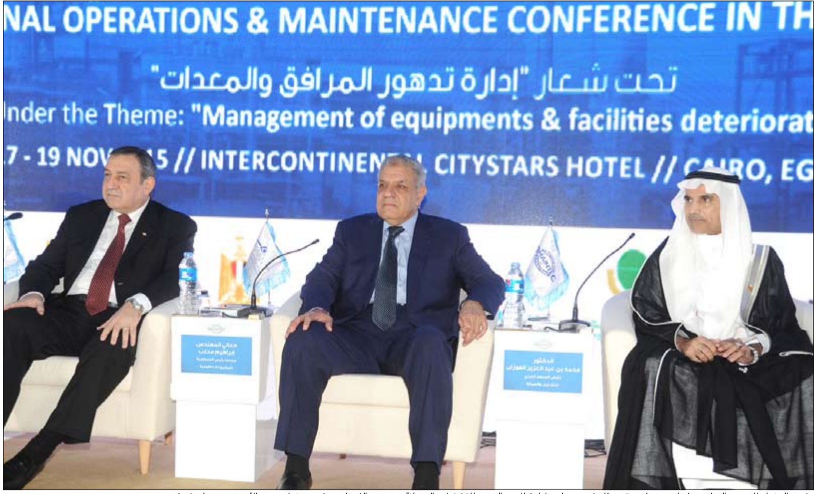
رئيس الوزراء المصري السابق م.ابراهيم محلب متوسلاً رئيس مجلس إدارة المعهد العربي للتشغيل والصيانة د. محمد الفوزان ورئيس وزراء مصر الأسبق د.عصام شرف

رفع رئيس مجلس إدارة المعهد العربي للتشغيل والصيانة د.محمد الفوزان برفقة شكر وتقدير من المشاركين في الملتقى الى خادم الحرمين الشريفين الملك سلمان بن عبدالعزيز لمبادرته الكريمة بإنشاء برنامج كرسي الملك سلمان بن عبدالعزيز لدعم دراسات وبحوث الصيانة في الدول العربية، لافتاً الى ان هذه المبادرة سيكون لها آثار إيجابية في أعمال المعهد المستقبلية.