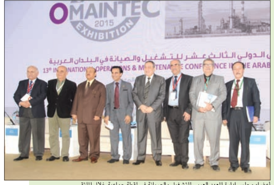
أعضاء مجلس إدارة المعهد العربي للتشغيل والصيانة في لقطة جماعية خلال الملتقى