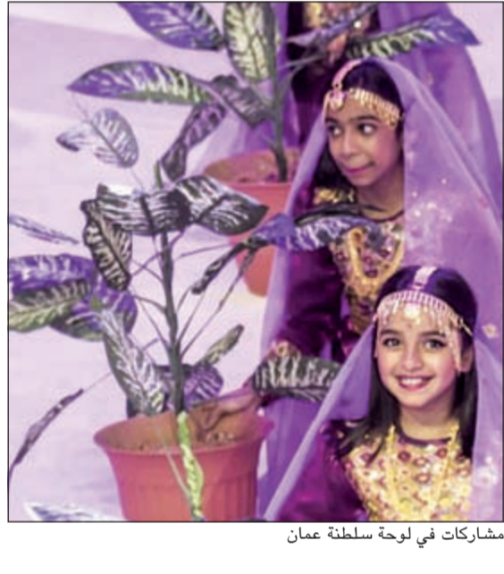
مشاركات في لوحة سلطنة عمان