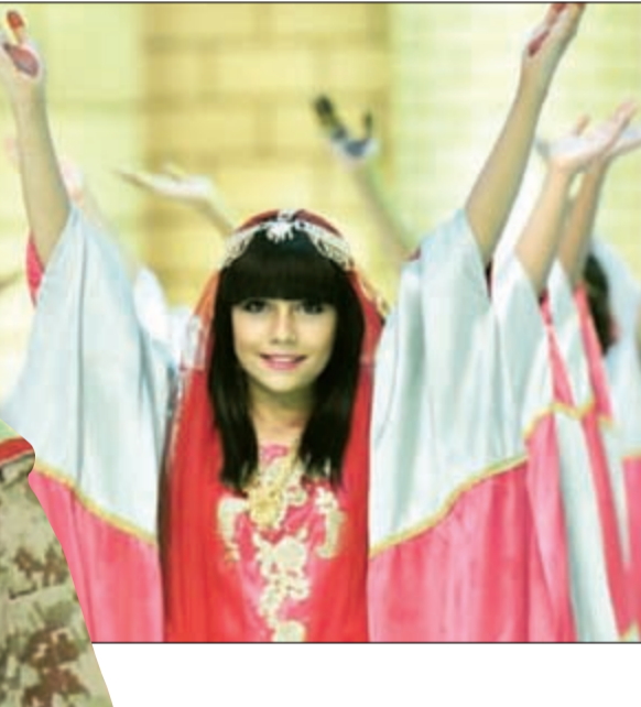
رقصات تعبيرية جميلة